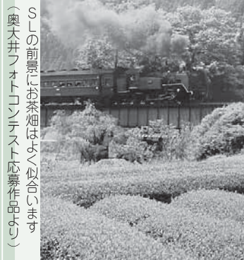
SLの前景にお茶畑がよく似合います(奥大井フォトコンテスト応募作品より)

AEDはコンピュータによって傷病者の心臓のリズムを調べ、除細動が必要かどうかを自動で判断します。操作方法は「音声」で示してくれます。