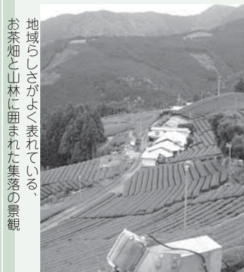
地域らしさがよく表れている。お茶畑と山林に囲まれた集落の景観

集落、河川などの景観が、どのように移り変わってきたのかを、地元の方にもお話を伺いながら明らかにしようとしています。このような調査資料をもとに、川根本町内の土地利用のこの百年間の変化を示す図を作成したところ、山の様子、集落のまわりの様子が大きく変わってきたことが読みとれました。また、河川と住民の生活との関係が大きく変わってきたことも明らかにできています。