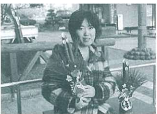
門松とわたし 茶茗館にて

：「新春」： それは北国にはまったく似合わない言 葉。このさぶいに何を言ってるのだ！と思っ ていました。でもウッドハウスで迎えた元 日は…暖かい！とびっくり。年が明けて一 夜にして春が来たのかとまじめに思っ てしまいました。こんな風に爽やかに始まった 19年。今年もきっと良い年になる気がしま す。では、また来月！