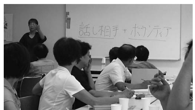
全6回の講座を通じて高齢者の特性や対話の作法など、ボランティアについて学びました。

今後、関係機関を通じて「話し相手の欲しい人」を募集し、さまざまな場面で話相手ボランティアとして活躍していただく予定です。