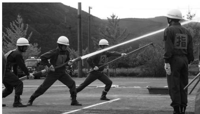
きびきびした操法に大きな拍手が送られました。

署杉山署長は「近年、自然災害の恐ろしさを見せつけられている思いがします。あらゆる災害から住民の生命と財産を守るため、これからも精進してください。私たちも消防団の皆さんと共に、災害のないまちづくりのため努力していきたい」と団員に向けて激励を送りました。