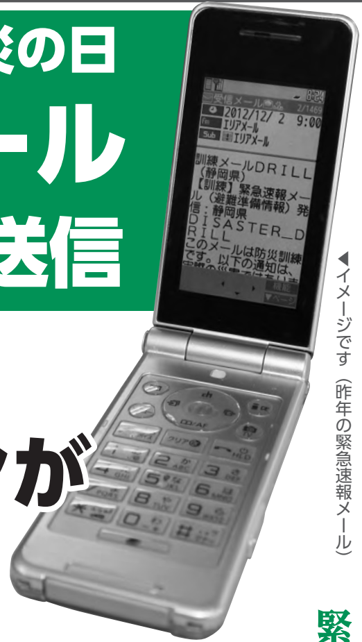
イメージです(昨年の緊急速報メール)