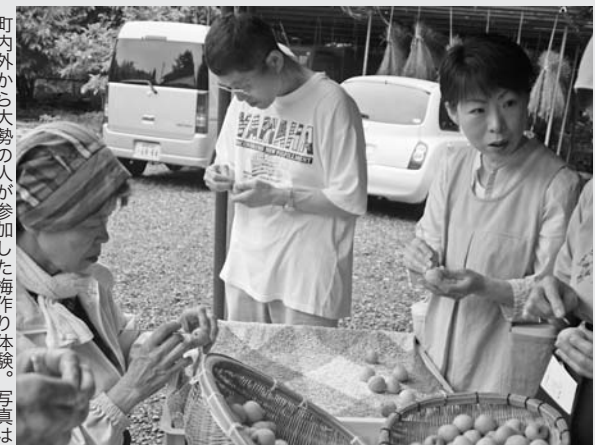
町内外から大勢の人が参加した梅作り体験。写真は1回目の体験(梅の実のへた取り)の様子

日本の伝統的な食文化を見直そうと「癒やしと食」部会が企画したもの。参加者はこの日の梅の塩漬け作業を体験したのち、7月19日には梅の赤しそ漬け・樽詰め作業を体験。全2回のワークショップを通して、日本の伝統の食文化を学びました。