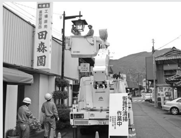
日ごろの感謝を込めて実施された清掃・点検作業

この町に起こった新鮮な「ネタ」を皆さんの元へ。この次に登場するのはあなたかも!!