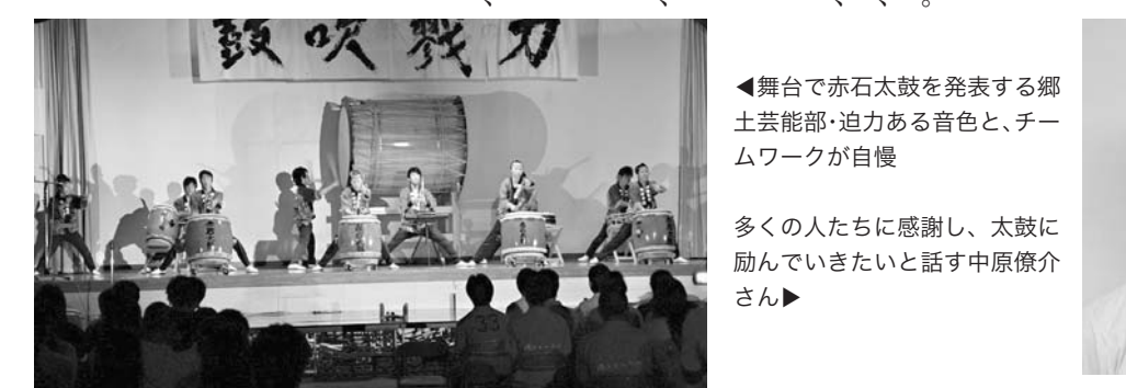
◀舞台上で赤石太鼓を発表する郷土芸能部・迫力ある音色と、チームワークが自慢

部活内の雰囲気はとてよく、互いに指摘し合ったり、励まし合ったりと、共に成長しています。基礎練習を中心にやっているおかげか、1年生はめきめきと力をつけ、2年生は、音や体のキレが増してきました。また、曲の精度も上がっているように思います。この基礎中心の練習を、これからも継続してやっていきたいと思っています。