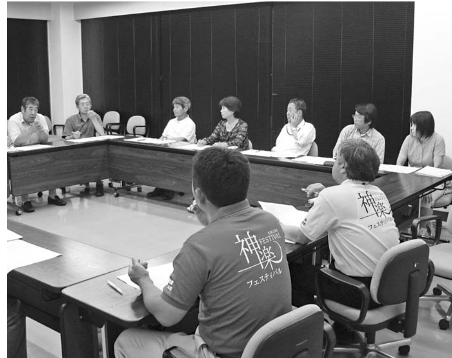
生涯学習推進協議会研修会・情報交換の様子

発表の後は、参加者が5つのグループに分かれ、各地区の今年の事業計画について情報を交換しました。