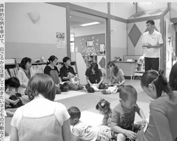
具体的な例を挙げて、日ごろから注意しておきたい子どもの行動などについて学びました