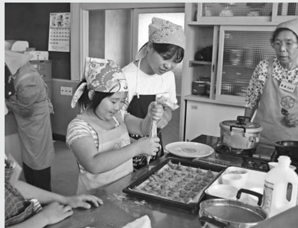
お茶を使ったクッキー作りに挑戦しています。思ったよりも簡単にできあがりました

これは、昨年度の商工会合併を機に各支部ごとに取り組み始めた活動の一つで、普段お世話になっている地域への貢献を目的としています。当日は会員など12人が参加して、高所作業車を使い、街路灯の電灯部分や傘の部分の清掃・点検を実施しました。