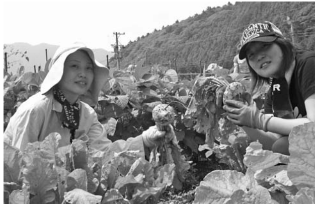
大きくなった野菜を手に・1日目農作業

ちゃっきり娘養成講座の第3回は6月27、28日の両日、農林業センターで開かれました。