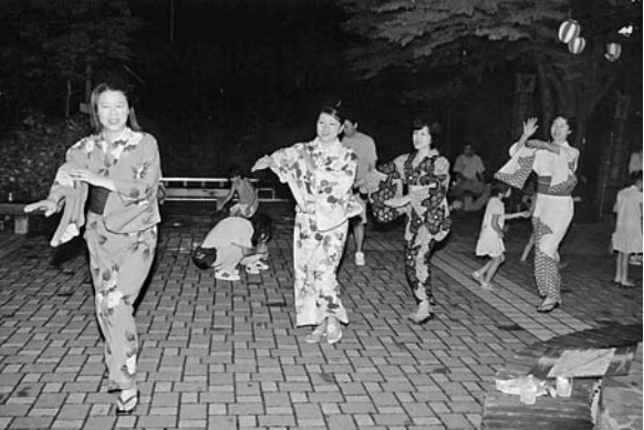
左ページ写真は昨年のプチ盆踊りの様子