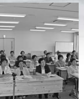
更生保護女性会の総会

強調月間の初日となる7月1日に、啓発街頭キャンペーンを展開しました。保護司・女性会など関係者約80人が町内6カ所に分かれ、啓発用のタスキをかけ、のぼり旗を手に、非行防止などを呼びかけました。