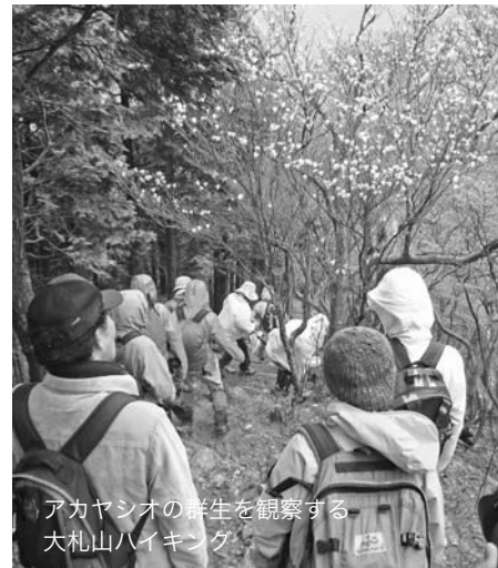
アカヤシオの群生を観察する大札山ハイキング

本年度に入り、徳山地区の満開の桜や、アカヤシオの群生を観察する大札山ハイキング、一番茶の手摘みや梅干作り（本号まちの話題に記事）を体験するなど、多彩なエコツアーを開催して町内外から多数の皆さんにご参加いただいています。