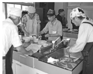
6月23日の教室の様子