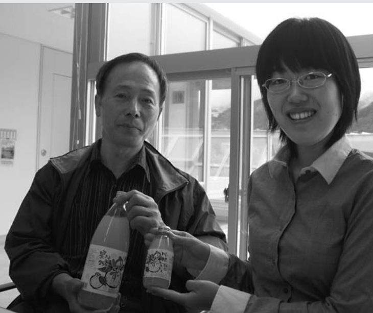
自然味あふれるゆずのジュースは、すがすがしい。