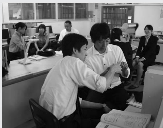
デジカメの動画機能を活用したインタビュー実践

昨年に引き続き今年も6月10日に実施されたこの環境美化活動。商工会女性部員や商工会職員など35人が参加し、川根大橋のたもとや地名地区など町内3カ所で、清掃活動や花壇の植栽、草取りなどの作業に汗を流しました。商工会女性部は、女性ならではの視点を生かした活動でまちづくりに励んでいます。