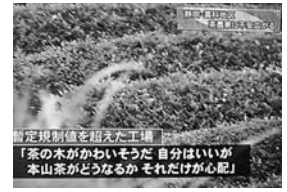
▲6月10日夕方、テレビのニュース番組では、悲嘆に暮れる本山茶産地の茶工場関係者が「自分のことよりも本山茶自体がどうなるか心配」とコメントを述べていた。

静岡市は6月15日、放射線を出す能力の強さを表す単位「ベクレル」から、被ばく程度を示す単位「シーベルト」に換算した数値を発表した。市環境保健研究所によると、藁科地区で規制値を超えた679ベクレルの放射性セシウムを含む製茶を、仮に毎日10 2 ずつ1年間食べ続けた場合の年間被ばく線量は「約0.03 3 シーベルト」になるという。国が定めた年間被ばく限度「1 3 シーベルト」を大きく下回る数値。この数値は、胸部レントゲン検査1回の被ばく量(0.05~0.1 3 シーベルト)や東京-ニューヨーク間を片道飛行した際の被ばく量(0.1ミリシーベルト)も大きく下回っている。これは茶葉を食べた場合の数値であり、飲用する場合には、さらに数値は低くなる見積もりだ。藁科地区で検出された放射性物質質量679ベクレルを大幅に下回っている川根茶(350ベクレル)は、数値上、「安全」が証明されたと言えるのではないだろうか。