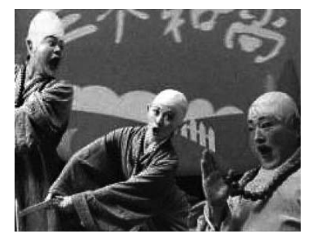
三人の和尚 Three Buddhist Monks

日時 7月23日(土) 午後1時30分開場 午後2時開演予定 場所 文化会館ホール 演目 三人の和尚 済南児童芸術劇院(中国)