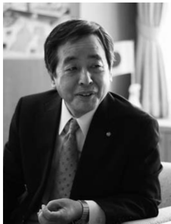
川根本町茶業振興協議会