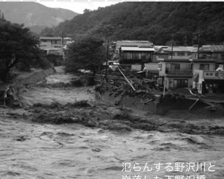
氾らんする野沢川と崩落した下野沢橋

昨年9月8日。台風9号の接近・上陸により小山町は、午前10時に時間110分、午後4時には時間120分という記録的な豪雨に見舞われ、河川の増水や土砂崩れによって甚大な被害が発生しました。町では、当日午前10時から開かれていた議会9月定例会を急ぎ中止して、災害対策本部を設置。町内7地区に対して避難勧告を発令し、168世帯、350人が小学校や公民館などに身を寄せました。午後3時10分には、柳島地区の野沢川が氾らんして地区が孤立。自衛隊に派遣を要請し、救助などの活動に当たりました。国土交通省からは緊急災害対策派遣隊（テックフォース）が現地に駆けつけ、災害復旧のための現地調査などを実施しました。