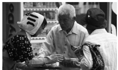
5月22日に展開した「安心・安全な山のお茶・川根茶キャンペーンの様子。茶娘が観光客らに川根の新茶を振る舞った。

一般的に、消費者は本山、牧之原、掛川、川根など茶産地ごとの意識というのは少なく、「静岡茶」という目線で茶を求めます。川