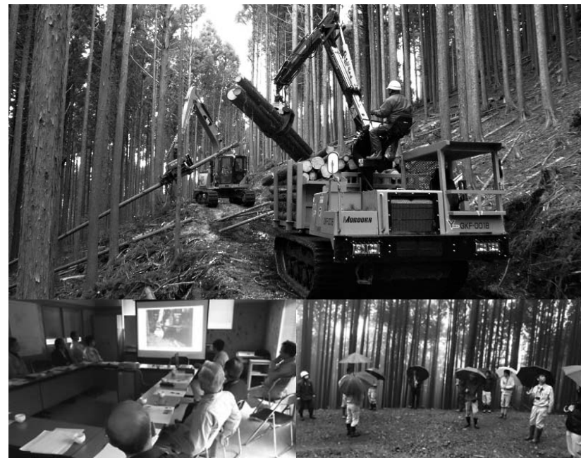
写真上から時計回りに 高性能林業機械を使った木材生産、現地で実施した現地確認の様子、森林組合事務所で開催された意見交換の様子

※プランナーとは…森林の状況や作業内容を見定めて、伐採や林内作業路、出材といった作業経費と補助金や売り上げを計算したプラン書を作成する職員のこと。今後は、作業後の目標や将来へ向かってどのような森林にしていくかについても案内をしていきます。