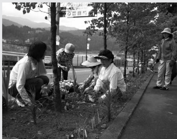
昭和35年6月10日に商工会法が施行され、この日を記念して昭和60年、毎年この日を「商工会の日」と制定。