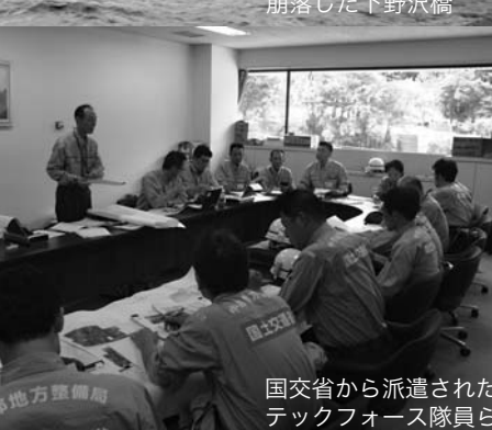
国交省から派遣されたテックフォース隊員ら