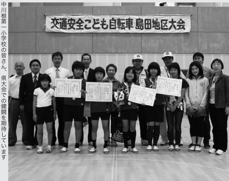
中川根第一小学校の皆さん、県大会での健闘を期待しています