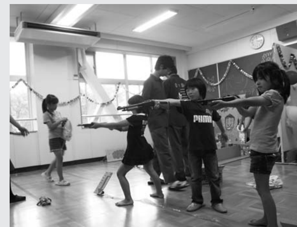
21HRのゲームコーナーは子どもたちに大人気

4日は「校内発表」として、吹奏楽や有志のダンス、バンド演奏などの発表会を開催。「一般公開」の5日は、保護者や卒業生、町民などが、多数川根高校に詰めかけました。生徒会を中心に全校生徒が4月から準備を進めてきた作品展示や、模擬店、自主映画上映会、趣向を凝らした出店の数々が来場者を楽しませました。