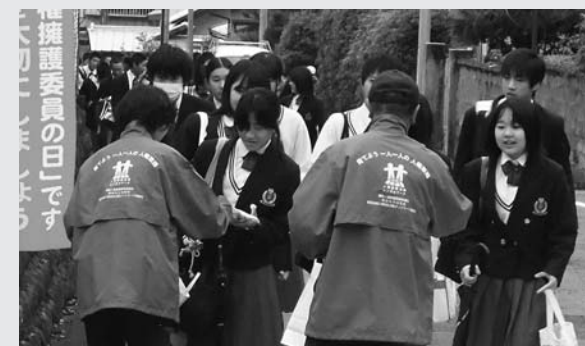
朝のあいさつが飛び交う川根高校校門前で

「人権擁護委員の日」に伴う街頭啓発は6月1日早朝、川根高等学校で実施され、人権擁護委員、学校教職員、役場職員が参加しました。校門前に立った参加者は、元気よくあいさつする生徒たちに声をかけながら、グッズを配り、人権擁護を啓発しました。活動終了後には、町内2カ所に特設人権相談所を設けました。