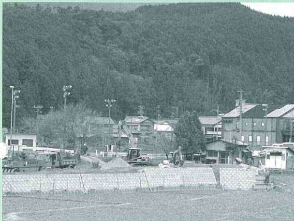
公営住宅を整備します（写真は予定地周辺（地名地区））