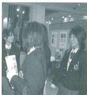
非常に参考になった見学会