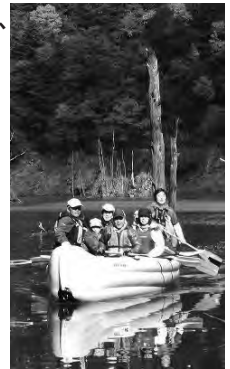
①紅葉満喫カヤックツーリングにて。湖面から見る紅葉に大満足!

というわけで、2013年も地域の皆さんと一緒に、エコツーリズムで川根本町を盛り上げていきますので、よろしく願います!