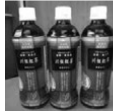
◀川根紅茶 ペットボトル