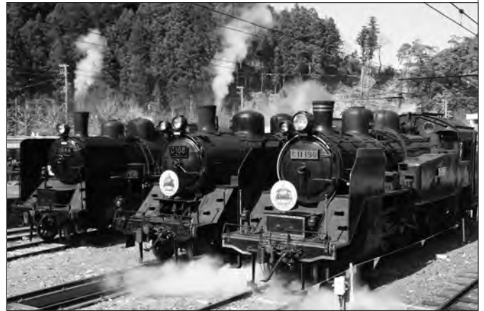
圧巻は3両のS Lが一斉に汽笛を鳴らすシーン

S Lフェスタでも人気がある、3両のS Lが並ぶ10分間の奇跡「S L 大集合」には、貴重な光景をカメラに収めようと黒山の人だかり。さゆり幼稚園児が披露したダンスも評判でした。