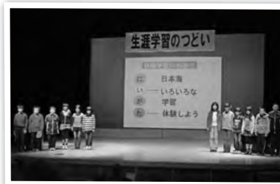
▼小学生県外体験学習の報告(中川根第一小5年生)