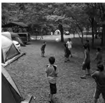
▲自然環境に恵まれたキャンプ場

応募に関する詳細や申請書類などについては商工観光課までお問い合わせいただくか、町ホームページをご確認ください。