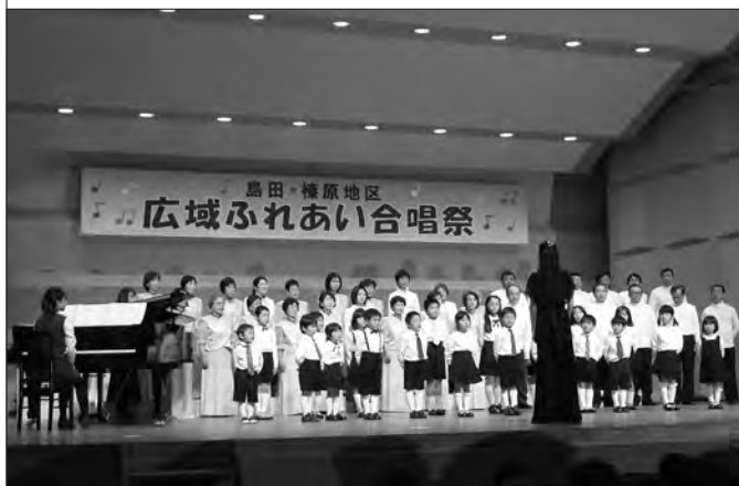
来年、結成10周年を迎える「さゆり合唱団」