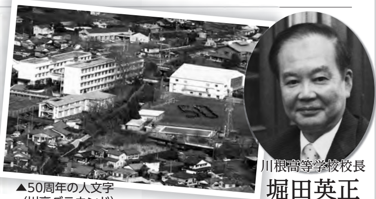
▲50周年の人文字 (川高グラウンド)

【主な進路先をご紹介します】(3月1日現在) 【国公立大学】茨城大学理学部、静岡大学工学部、静岡大学 教育学部、都留文科大、静岡県立大学短期大学部(看護) 【私立大学】常葉大学保育学部、帝京大学文学部、静岡産業 大学経営学部、静岡英和学院大学短期大学部(食物)、聖隷 クリスティーナ大学リハビリテーション学部など 【専門学校】大原簿記情報医療専門学校、東海福祉専門学 校、静岡福祉医療専門学校、静岡工科自動車大学など 【就 職】J A大井川、川根本町役場、中部電力、大井川 電機製作所、特種東海製紙株式会社、トヨタ自動車、中島 屋ホテル、あかいしの郷など