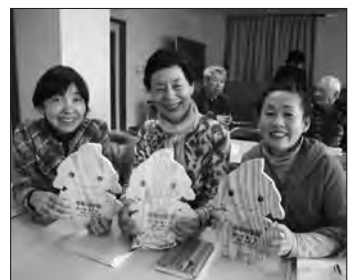
▲修了証に笑顔の学生