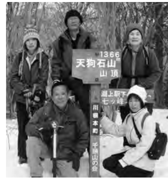
◀ 2月17日、エコツアーとしては初めての冬山トレッキングを開催しました

川 根本町を元気にする「着地型観光」とやらを一緒にやってみませんか？携わった人みんなに「やってよかった」と思ってもらえるよう、全力でサポートします！