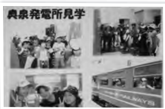
▼海の子山の子交流教室