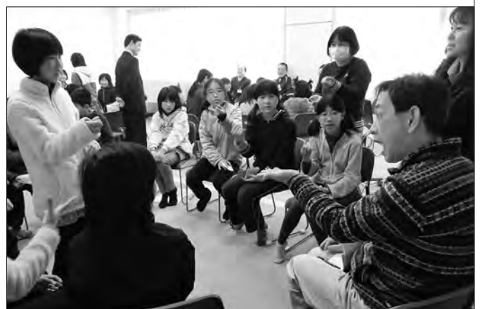
ジェスチャーや表情が大事だと学びました

児童らは、身近に聞こえない人がいることを理解し「通じる喜びを知った」「手話をもっと勉強したい」などと感想を話していました。