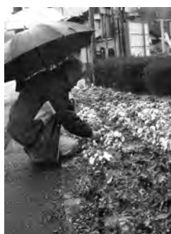
▲「田代花の会」の花壇でアドバイスを

現地で花壇を見ながら「地面が砂地だと水はけが良くないので、土・堆肥・腐葉土を入れるなどの土壌改良が必要」「この花壇には、ヒマワリ・菜の花・コスモスのような背が高い花が、どの角度からみてもきれいに見え、適している