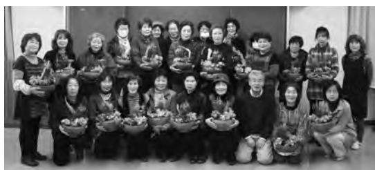
最上り植えの寄せ植えを撮る⑤、最上り寄せ植えの方法を学ぶ⑥、出来上がった寄せ植えを持って記念写真を撮りました。

のではないかなど、花壇に合わせたアドバイスを受け、参加者は日ごろ苦勞していることや疑問に思っていることを講師に熱心に聞いていました。講演会は「花壇をデザインする時、直線や曲線を使って楽しくやってみてはどうか」「予算を掛けずに花壇を作る工夫として、花を植える面積を減らし、そこに流木やオブジェを置いてデザインしてみては」など、今後の花壇管理に役立つことを学びました。