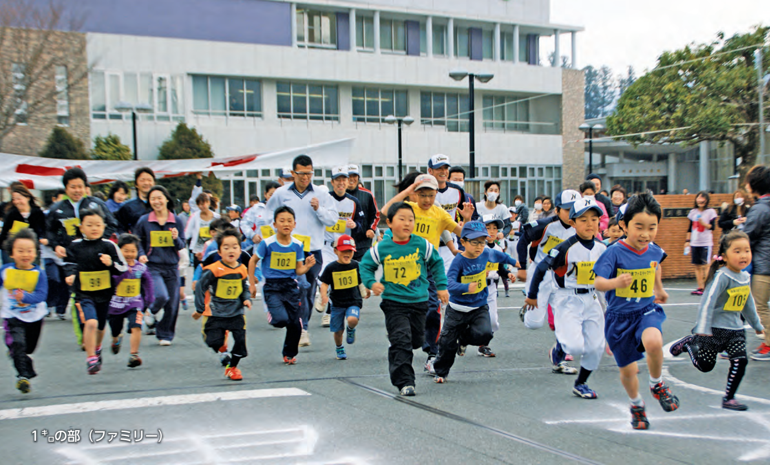
1 キ の部 (ファミリー)