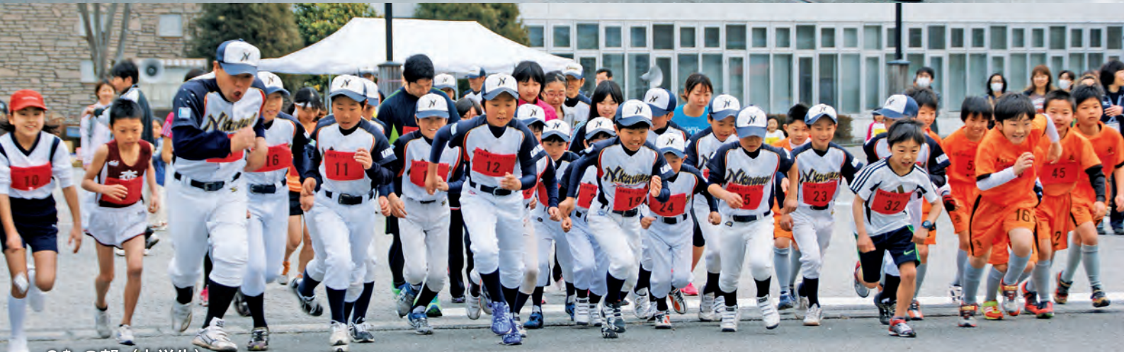
3 キ の部 (小学生)