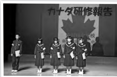
▼中学生海外英語研修の報告(中川根中参加生徒)