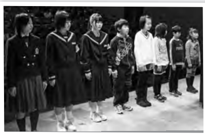
▼町民読書感想文・感想画コンクール表彰式