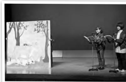
▼おはなしどんぐり