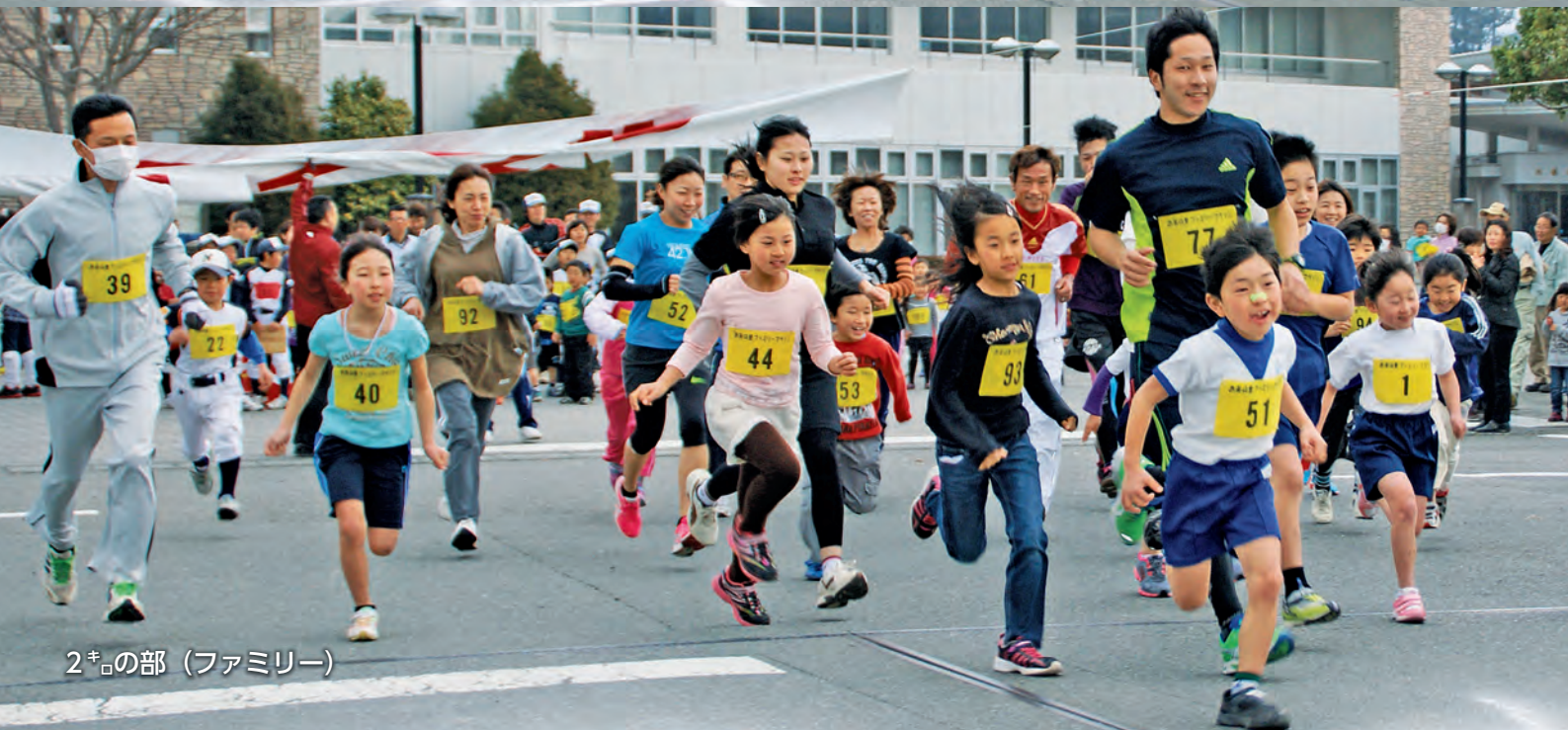
2 キ の部 (ファミリー)