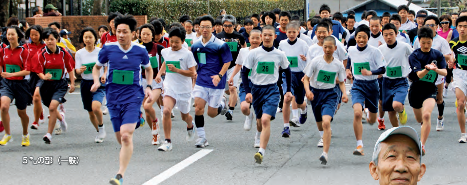
5 キロ の部（一般）

3月10日、役場本庁舎周辺を会場として生涯学習課主催の「生涯学習スポーツのつどい」が開催されました。子どもからお年寄りまで、多くの皆さんに参加していただき、それぞれの種目で交流を深めました。