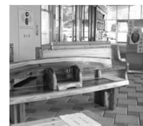
出品されたベンチ作品 最優秀賞に選ばれた(有)建商の作品は座板や背もたれに特徴があり、左右にスライドする幼児用のいすが設置されている点などが高く評価されました。

年度中にFSC材を使って制作し、ロゴマークを入れて、町内の公共施設に設置されます。