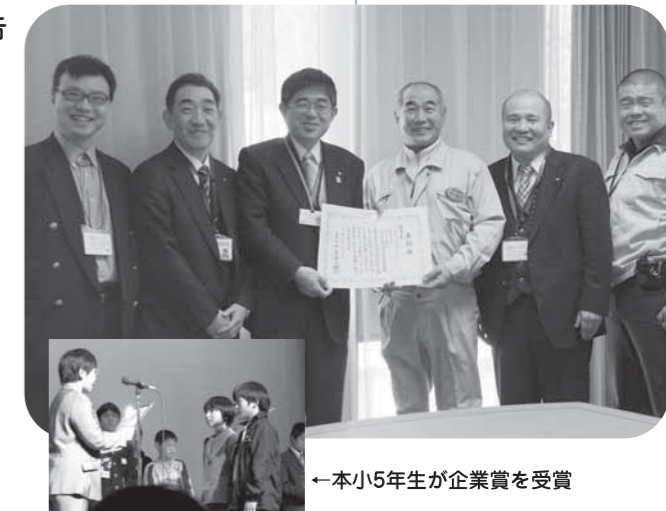
←本小5年生が企業賞を受賞

なお、第2回STOP温暖化グランプリに本小5年生が出場し、「エコな楽器づくり」活動が企業賞 (ヤマハ賞) を受賞しました。