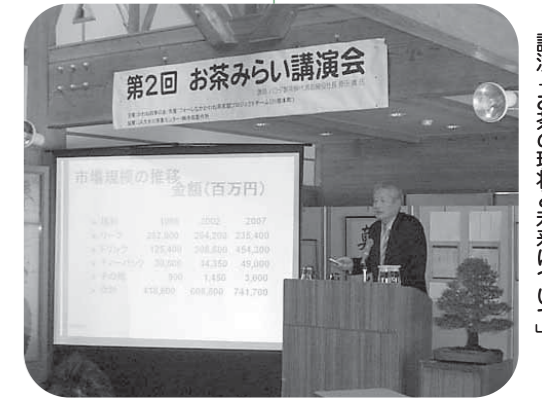
講演「お茶の現状と未来について」

原田社長は、手軽なお茶ペットボトルに走る消費者ニーズや、コンビニエンスストアが増加し茶専門店が減少している現状を説明。茶摘採など農作業の合理化、共同工場の考え方、特色ある品種の導入など、改革の必要性を訴えました。