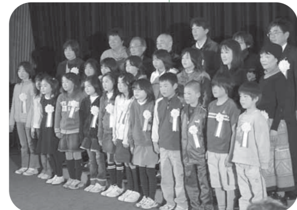
皆さん、入賞おめでとうございます

「年々作品のレベルが上がっているが、今年は、非常に手の込んだものが多く、審査も楽しかった」と講評がありました