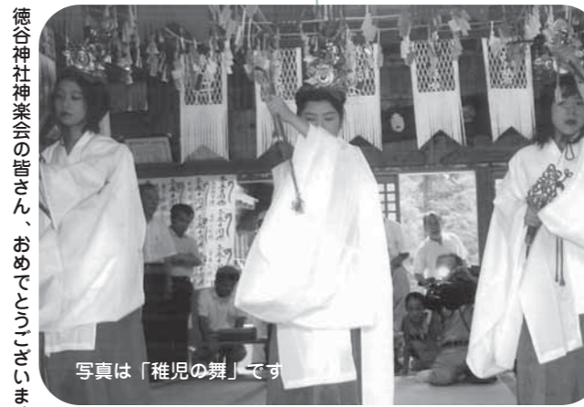
徳谷神社神楽会の皆さん、おめでとうございます

以来、34年間、この稚児の舞は祭典には欠かせないものとなり、子どもたちの華やかな舞と演出が、保護者をはじめ大勢の観客に喜ばれ今日にいたっています。今回、この「世代を超えた地域交流活動」が評価され、受賞となりました。