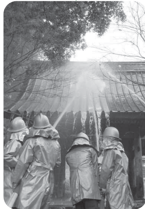
山門に向けて一斉放水！川根本町の重要な財産を守ります

訓練では、参加したそれぞれの各隊において、情報の伝達やコースの中継を素早く行うことが重要であると認識でき、また、町の財産である「文化財」を守る意識を持つことができた有意義な訓練となりました。