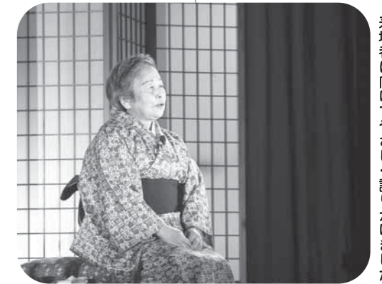
来場者に向けてやさしく語りかけました

この語り部まつりは、芸能・民話を語り継ぐことで「日本のふるさとの原風景の残る里」として、地域を代表する文化イベントに育て上げていこうという意気込みで、今回で9回目を数えます。