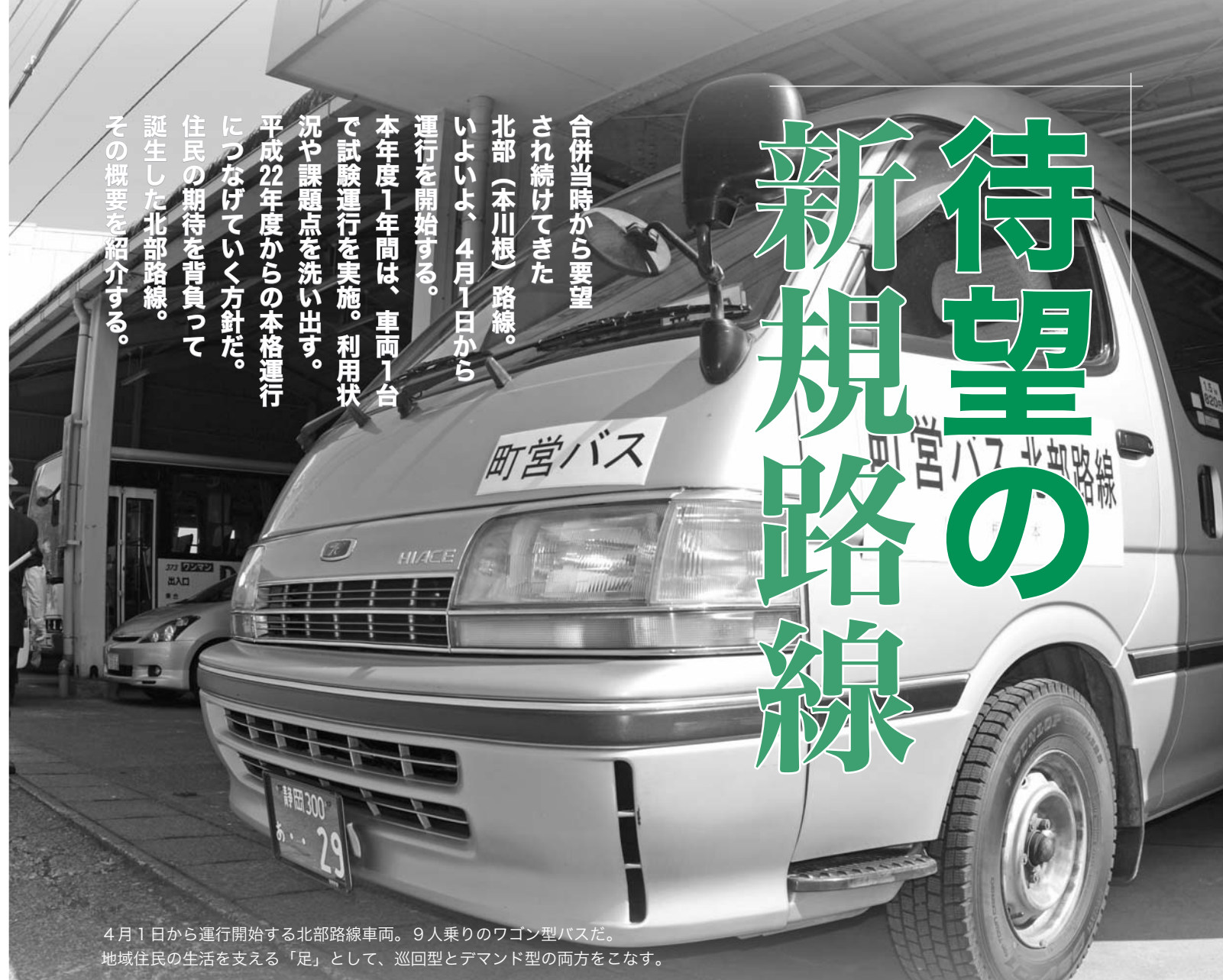
4月1日から運行開始する北部路線車両。9人乗りのワゴン型バスだ。地域住民の生活を支える「足」として、巡回型とデマンド型の両方をこなす。

合併当時から要望され続けてきた北部（本川根）路線。いよいよ、4月1日から運行を開始する。本年度1年間は、車両1台で試験運行を実施。利用状況や課題点を洗い出す。平成22年度からの本格運行につなげていく方針だ。住民の期待を背負って誕生した北部路線。その概要を紹介する。