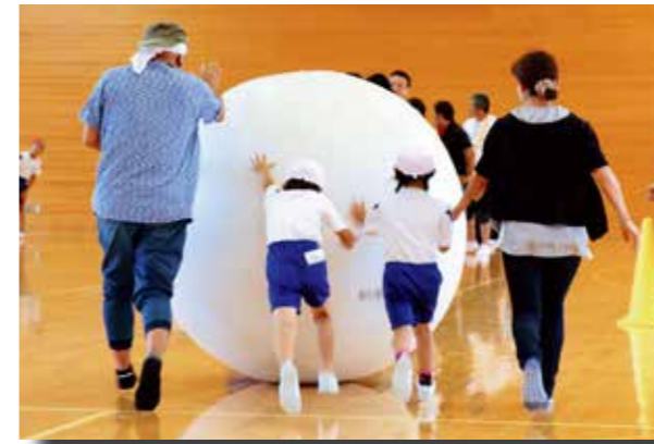
●午前の競技は体育館内で行われ、地域の人も参加しました