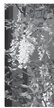
黄色の花が咲いています

ご近所さんや、診察帰りの人からは「珍しい花ですね」、「私も欲しくなったよ」などの声が聞かれています。このこと。本川根診療所では、このキングサリをもっとたくさん植えて、診察に来た人たちの目を楽しめたいと話してくれました。