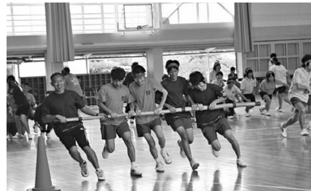
◀グラウンドで開催するのと変わらないくらい盛り上がり、笑顔があふれた体育祭

一人一人の笑顔や、頑張る姿がうれしかった。その後も、白熱した種目が続きました。リレーや長縄、障害物競争など、体育館とは思えないほどの盛り上がりを見せました。雨でも楽しめるよう、一つ一つの種目に工夫を凝らしたかいたと実感できました。一人一人の笑顔や、必死に走る姿、頑張っている姿を見ることができ、とてもうれしかったです。