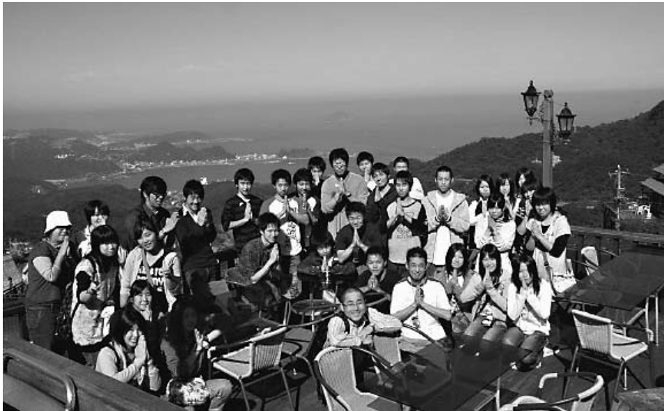
12月1日から5日まで実施された修学旅行。雄大な景色をバックに記念撮影