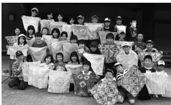
▼みんなで お茶染め体験を