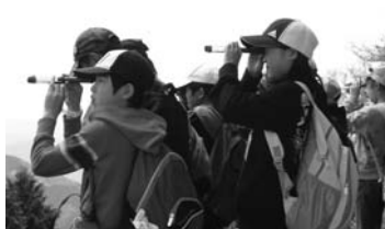
◀大札山からウオッチング

2日間の主な活動とお世話になった講師のみなさんは下記のとおりです。(敬称略) 奥泉水力発電所見学と井川線乗車(中部電力榑大井川電力センター業務グループ職員)、お茶染め体験(緑のたまてばこ)、お茶の試飲(茶茗館職員)、お茶を学ぼう・闘茶会、もりのいずみ入浴、大札山シロヤシオハイキング(川根本町エコツーリズムネットワーク会員)