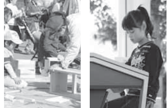
木工教室にて 真剣なまなざし