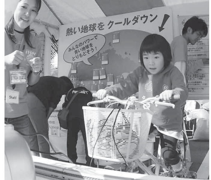
自転車で電気を起こしています 模型の新幹線は走るかな？