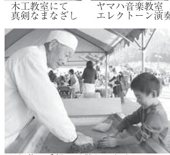
お茶の手揉みは難しいね！