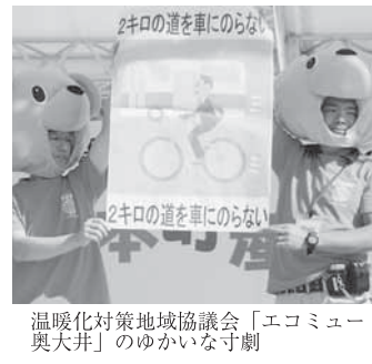
温暖化対策地域協議会「エコミュー 奥犬井」のゆかいな寸劇