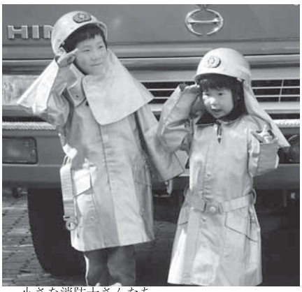
小さな消防士さんたち