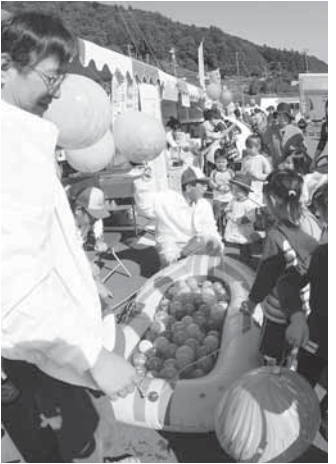
子どもたちが殺到！ ヨーヨー釣り