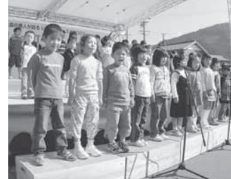
保育園児たちの元気な合唱