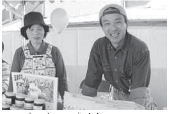
いらっしゃいませ！ 販売ブースにて