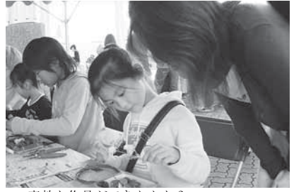
素敵な作品ができたかな？ ドライフラワー工作教室