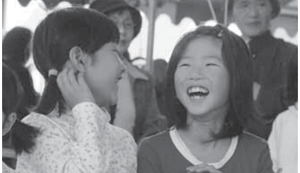
たくさん笑顔があふれた産業文化祭でした