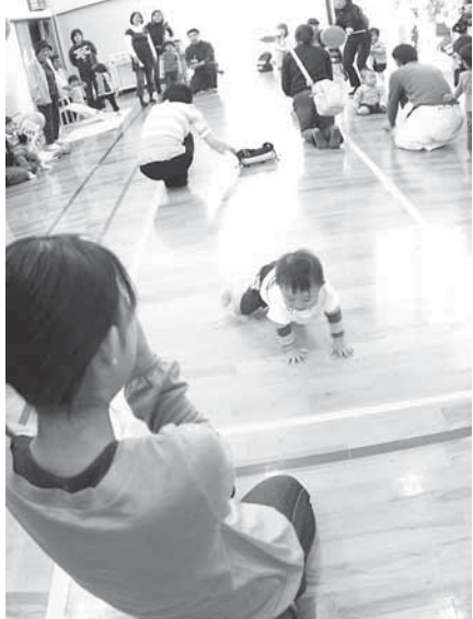
赤ちゃんのハイハイ競争 お母さん目指して頑張れ！