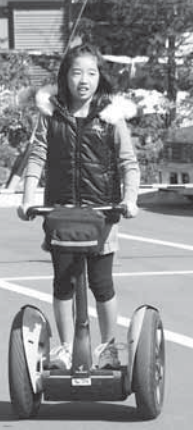
セグウェイの試乗 も人気でした