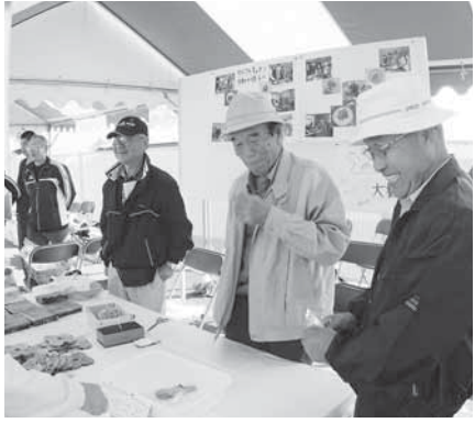
おじさんキッチンによる出店ブース 手づくりクッキーが好評でした