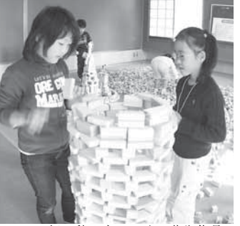
10000個の積み木でつくる芸術作品 (後ろにも積み木がドッサリ)