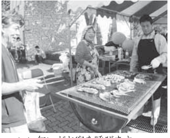
いい匂いがお客を呼びます いか焼き