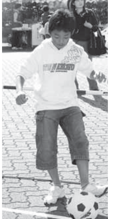
どきどきスルーバス 何個抜けたか？