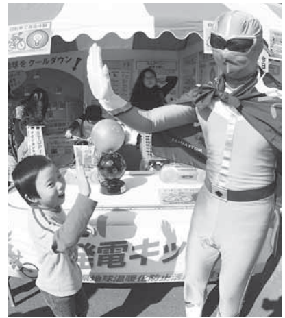
環境戦士？エココミュニオンとハイタッチ