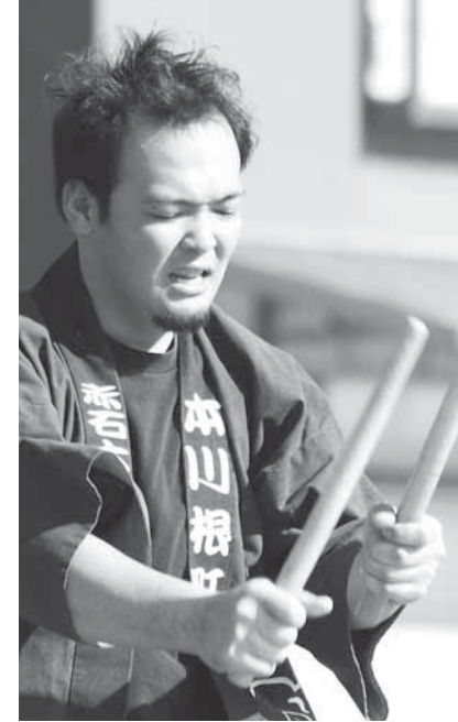
無双乱れ打ちとはとにかく迫力！カッコいい！ 赤石太鼓保存会