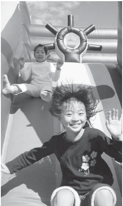
子どもたちに一番人気の「フワフワ」 (撮影のため特別に中に入れてもらいました)