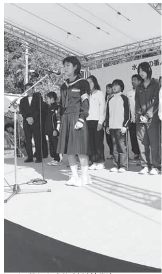
しずおか市町村対抗駅伝の 激励会が行われました