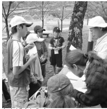
わんぱくセミナー

わんぱくセミナーには町内外から14人の小学生が参加しました。エコツアーには9人が参加、遠く東京や千葉から参加した人もいました。どの参加者も楽しい1日を満喫した様子です。