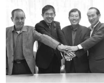
がっちりと握手を交わす瀬平区役員の皆さんと杉山町長