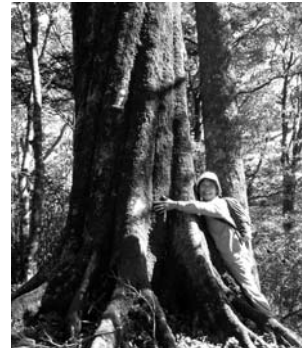
人よりも太いブナの木