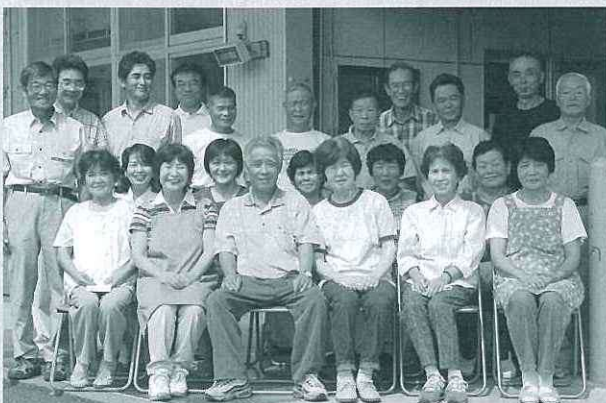
農事組合法人中川根はちなか園（八中） 普通煎茶10kg入賞 3等17席