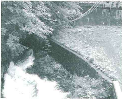
大井川から田代ダムに取水される水 (田代ダム取水口にて(手前が田代ダム側))