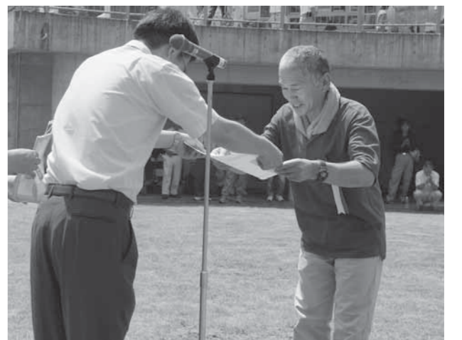
白旗史朗氏写真コンテストの表彰式