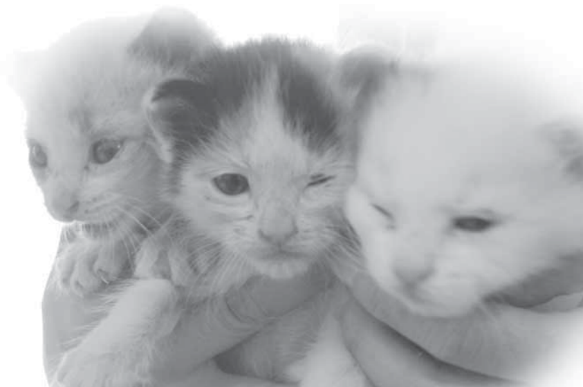
この子猫たちは、最近、実際に役場に届けられた子たちです。幸いにも飼い主が見つかり引き取られていきました。しかし、引き取り手が見つからないまま、残酷な運命を辿ってしまう猫たちは、悲しいことですが、実際に多くいます。

犬や猫などのペットは現代人の心を癒し、心を豊かにしてくれる存在として多くの人々に飼われています。