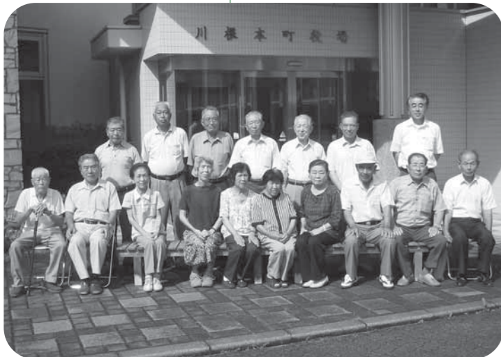
参加者皆さんで記念撮影を行いました これからも健康な歯を大切にしてくださいね