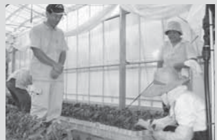
重労働の挿し木(合間の一休み)