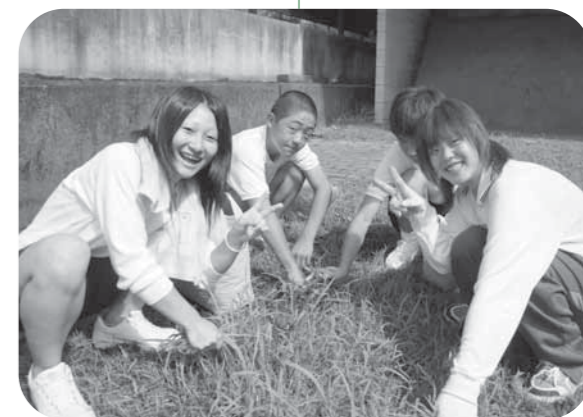
暑い1日でしたが楽しそうに取り組みました

このうち、山村開発センター横の弓道場には26人の生徒が参加。暑い日で日陰も少ない場所でしたが、真剣に、和気あいあいと草むしりに精を出していました。普段はあまり交流のない中学生と高校生がふれ合う場にもなっていました。