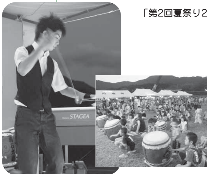
写真左はヨーヨー世界チャンピオンによる演技 右は、演技を夢中で見つめる大勢の来場者たちです

メインは何と言っても赤石太鼓保存会による赤石太鼓の演奏と、奥大井煙火保存会による手筒花火。8時30分頃から始まった手筒花火は目を見張るほどの迫力でした。1本炎が上がるたびに大きな歓声が沸き起こり、赤石太鼓の勇壮な音色と相まって、祭りは最高潮を迎え真夏の夜を彩りました。