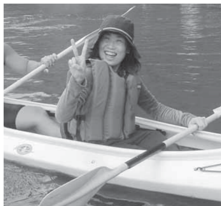
接叺湖でカヌー体験を楽しむ