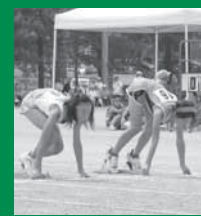
スタート前 緊張のとき