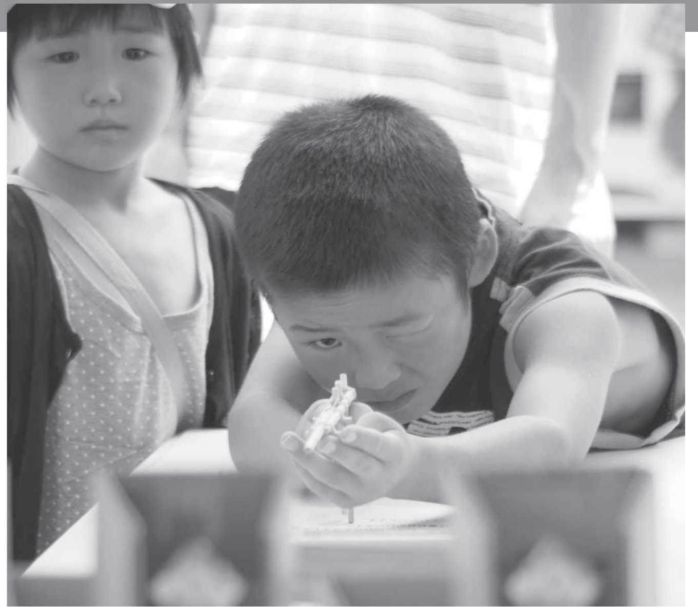
よく狙って！ 割り箸鉄砲に集中する