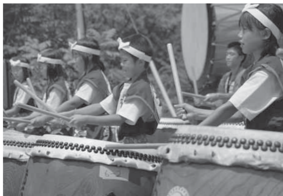
赤石太鼓ジュニアの元気な演奏