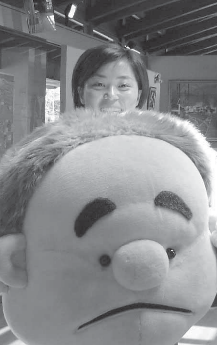
最近「あ、ちえの輪の人だね」と言われることが多くなりました。