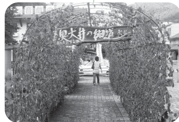
昨年に引き続いて「緑のカーテントンネル」が出現しました

「みんなで止めよう！地球温暖化」。川根本町から地球温暖化防止のメッセージをひろげましょう。