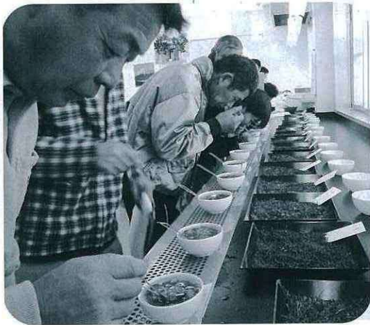
真剣な表情で試飲する参加者

会では、JA茶業センターでの各出品茶の成分分析結果も発表され、新茶シーズンに向け気運を高め合いました。