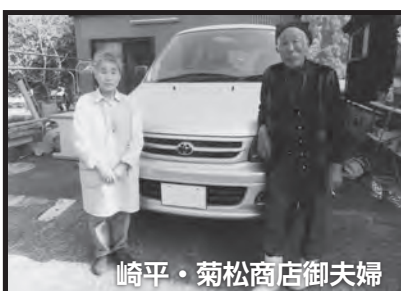
崎平・菊松商店御夫婦