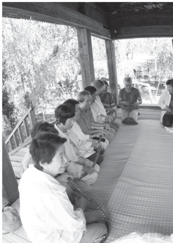
徳山愛宕地蔵にて 長く数珠をさわっています。ご利益があるらしいです