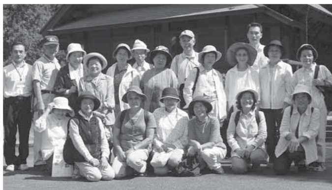
参加者の皆さんで記念撮影を行いました

皆さん、いずれの施設・名所も初めて訪れる場所が多く、熱心に説明に聞き入っていました。そして、この町の魅力を、楽しみながら再発見している様子でした。