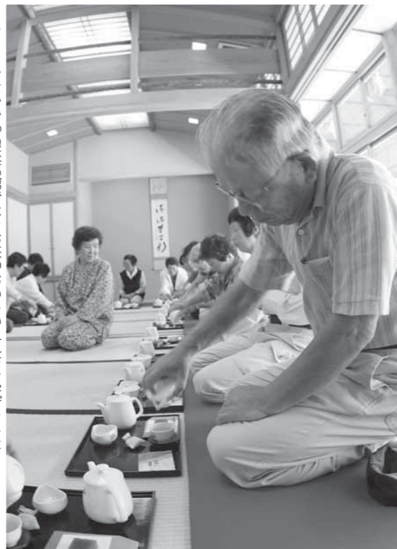
フォーレなかかわね茶茗館では、お茶の美味しい入れ方を学びました