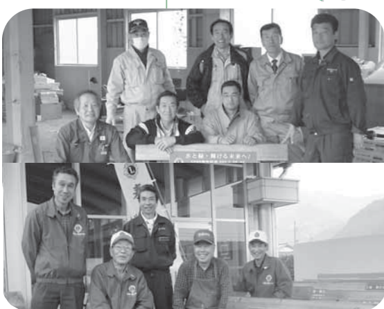
上…川根ライオンズクラブ本川根支部 下…川根ライオンズクラブ中川根支部

このたび寄贈いただいたベンチ30体は、音戯の郷や生涯スポーツ広場(小長井)、徳山の桜並木沿いなどに設置し、利用させていただきます。川根ライオンズクラブの皆さん、ありがとうございました。