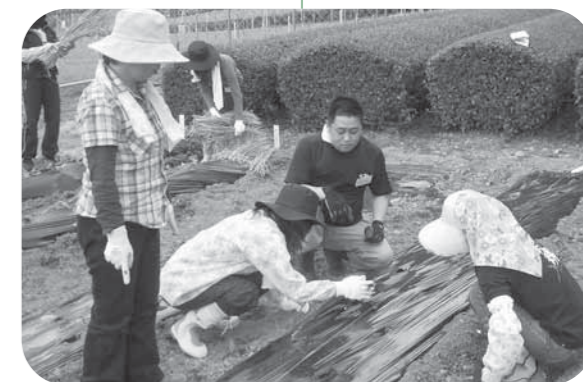
農林業センター(地名)での畑作業の様子です

初日は、さつまいもやトマト、とうもろこしなどの春まき野菜の種・苗植えの作業を、2日目は、水川地区で茶つき体験を行いました。「思っていた以上に楽しい1年間になりそう」、「農作業や山歩きなど自然とふれ合う中で自分探しをしてみたい」など、感想や抱負が聞かれました。