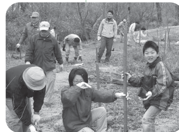
大勢の参加者がていねいに植樹を行いました

「この小さな苗が今後成長して、当地に生息している大きなブナのように自然環境や水源地の保全につながれば」と期待して植樹を行いました。この事業は3年継続事業で行なわれます。