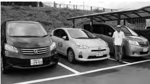
▲藤川地区から南部の方は川根本町シルバー人材センターが、青部地区から北部の方は大鉄タクシー千頭営業所が運行を担当しています。

利用に当たっては、事前に利用登録書の提出をしていただきます。その他、利用料や利用手続きについてはお問い合わせください。