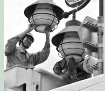
◀高所作業車を使い入念に磨き上げました。