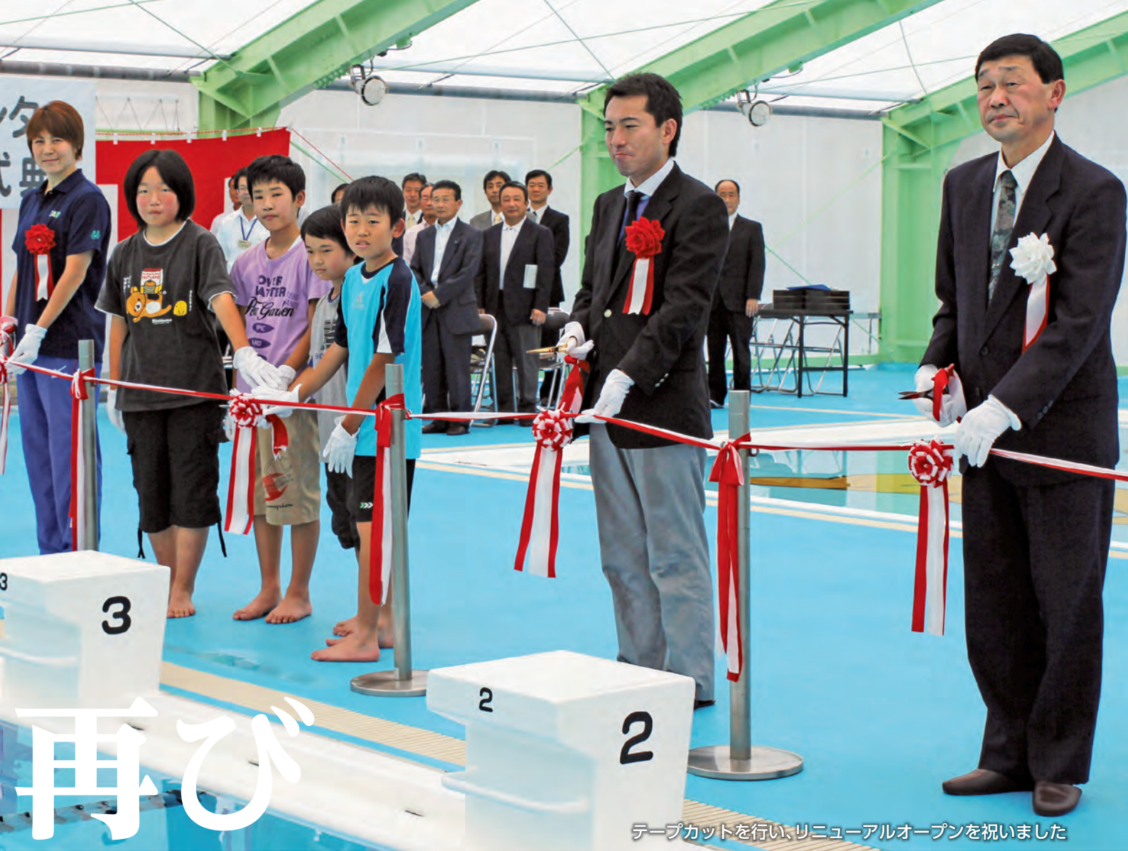
テープカットを行い、リニューアルオープンを祝いました

海洋センターは、B & G財団の協力により老朽化した施設の改修工事を行い、新たに快適で使いやすい施設に生まれ変わった。6月22日、温水プールのリニューアルオープンを記念して五輪メダリストである中村真衣さんを招き水泳教室などを開催した。