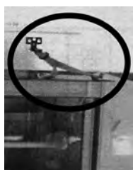
▲取り付け事例 ◀転倒防止具のサンプルです。取付作業費を助成します。

※「家具等」とは、住宅内の利用頻度が高い寝室、居間等に設置されている家具のうち、高さ・重量のある又は不安定なもので、転倒することにより生命又は身体に危害を及ぼすおそれがあるものをいいます。