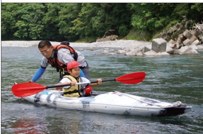
海洋センター職員の手ほどきでカヌーを楽しむ児童