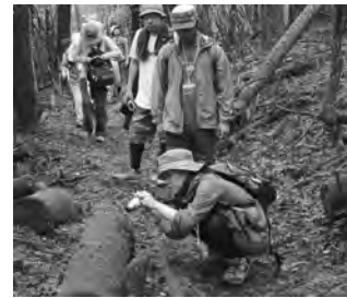
コケの魅力を撮りに取りつかれるコケガール

どのプログラムも大切なのですが、初めて実施する企画というのは特別に思い入れがあります。参加して下さる方にも「参加してよかった」と思ってもらいたいし、携わるスタッフにも「やってよかった」と思ってもらいたいからです。お客さんにも好評で、早くも第2弾の開催(9月)が決定しました。今回の反省を生かして、もっともっとよいプログラムを作り上げていきたいです。今後のエコツアーとコケツアーの活躍にご期待ください。