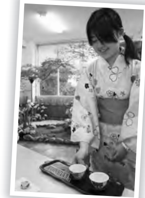
生徒会長として働いた南麓祭は、貴重な経験になりました。人を動かす覚をもって行動しなければなりません。なおかつ、その人たちのことをどれだけ考えられるかが大切だと感じました。文化祭が終わり、2日間の思い出を語り合っている生徒の姿を見たり、またやりたいという声を聴いたりしたときは、生徒会長をやっているよかったです。心の底から思える瞬間でした。

生 徒会長として働いた南麓祭は、貴重な経験になりました。人を動かす覚をもって行動しなければなりません。なおかつ、その人たちのことをどれだけ考えられるかが大切だと感じました。文化祭が終わり、2日間の思い出を語り合っている生徒の姿を見たり、またやりたいという声を聴いたりしたときは、生徒会長をやっているよかったです。心の底から思える瞬間でした。