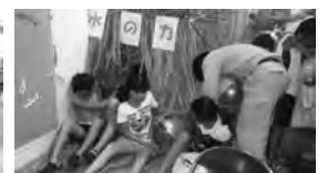
写真：昨年も多くの来場者でにぎわいました