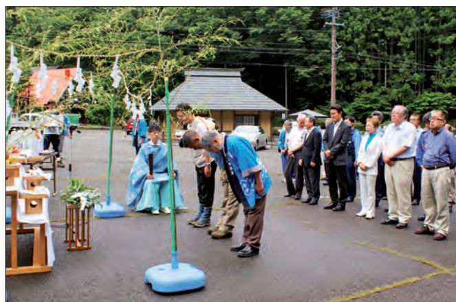
無事故を参加者全員で祈願しました

夜には、天狗と山伏が温泉街を練り歩く「天狗と山伏の湯かけ行列」や赤石太鼓の演奏が行われ、夏山シーズンの到来を祝いました。