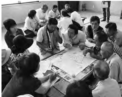
▲みなで入念に危険箇所をチェックすることで災害時に役立ちます

自然災害の脅威に対応するには、避難マニュアルを過信することなく、住民自らが危険を判断し、自主避難をするといった「防災意識の向上」が必要不可欠です。土砂災害の発生が予想される箇所や避難所を確認し適切な避難ルートを検討する「手作りハザードマップ」の作成や、土砂災害防止講習会の実施により、住民一人一人の防災意識を高めることができます。こうした取り組みの積み重ねによって、地域全体の防災力を向上させていくことが大切です。