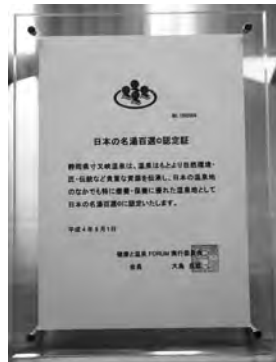
▲「日本の名湯百選◎」 認定プレート

【詳しくは http://www.onsen-forum.jp/ と検索してください】