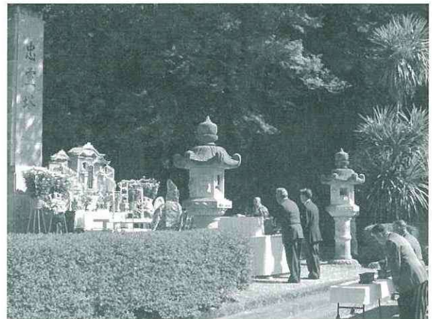
本川根忠魂碑での慰霊祭の様子