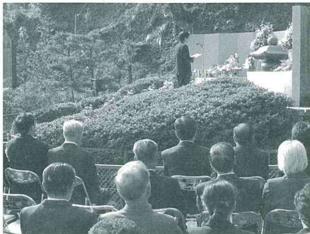
中川根忠魂碑での慰霊祭の様子

10月28日（金）、旧本川根町忠魂碑境内において、平成17年度川根本町本川根慰霊祭が、11月10日（木）には、旧中川根町忠魂碑境内において、平成17年度川根本町中川根戦没者慰霊祭が、それぞれ川根本町社会福祉協議会と川根本町の主催により厳粛なうちに挙行されました。