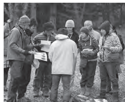
1月、寸又峡にて自然観察ガイド講習会を行いました。

ています。今後も「誰かにオススメしたいな」と思ってもらえるようなプログラムづくりやおもてなし、リピーターのお客様を飽きさせない工夫をより一層心がけたいです。そのための取り組みの一つとして「エコツアーファンクラブ(仮称)」の立ち上げを予定していますが、そのお話はまた次号で!!