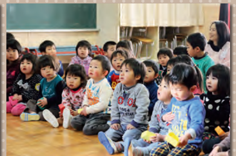
▲みんな真剣なまなざしで楽しむ