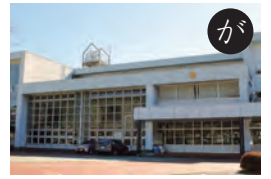
町立中川根中学校