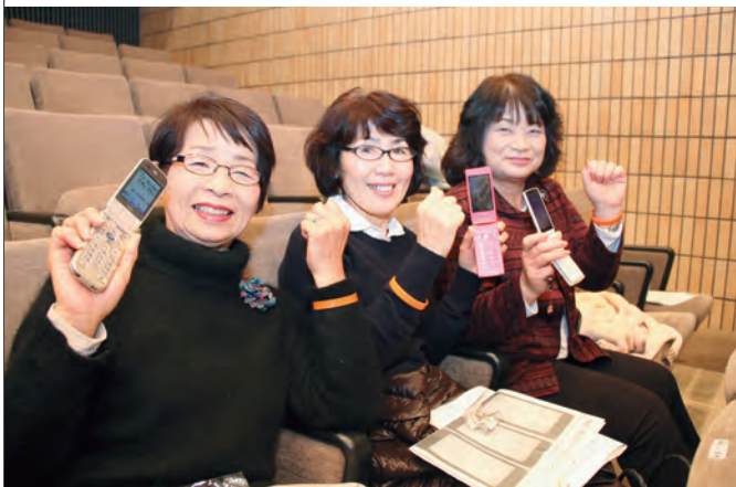
会場では認知症サポーター養成講座も実施されました

行方不明事案の早期解決・安心して暮らせるまちづくりのため、メール配信システムを導入