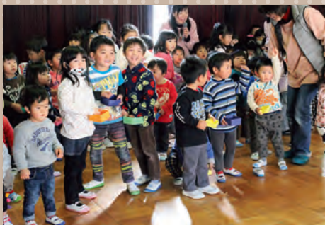
▲鬼の登場に笑顔を見せる園児たち

2月3日、三ツ星保育園児は節分の由来を紹介する手作り劇を鑑賞し、鬼を追い払う豆まきを行いました。特別に「鬼面ランチ」も振る舞われ、節分を楽しみました。