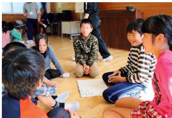
▲活発な意見交換に自然と笑顔がこぼれる

一方、音楽の合唱・合奏や体育のボールゲームなどは、多人数で行った方がダイナミックな活動が体験できます。理科や社会等の教科でも、関わり合いの中で多様な意見や考えを導き出したい場合は、ある一定以上の人数で学習した方が効果が高まります。