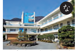
町立本川根中学校