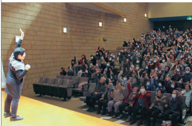
町内の高齢者や団体職員など約300人が参加しました

健康長寿のまちづくりに住民が主体となって取り組むことを目的に、介護予防講演会を開催