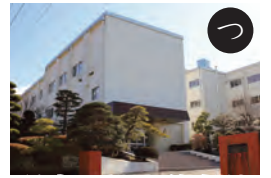
県立川根高等学校