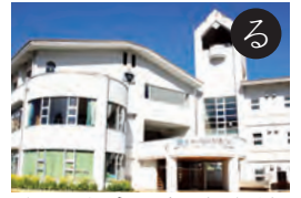
島田市立川根中学校