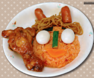
▲特別メニュー「鬼面ランチ」