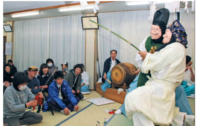
演者が舞台上を所狭しと舞った「恵比寿大国の舞」

ユーモラスな所作が人気の「恵比寿大国の舞」や哀愁漂う音色に乗せる「鬼の舞」、素早く華麗な刀さばきを披露した「梅津流太刀の舞」など17の舞が演じられ、笛や太鼓、にぎやかな笑い声やかけ声が響き渡りました。