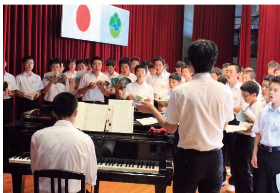
▲合唱や合奏は多人数での学習に適している

学校間連携グループ授業。 学校間で、学習内容に応じて、より効果的な学習の場を創り出し、子どもたち一人一人に学力の定着を図る。