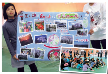
▲「G授業」の様子。子ども目線で地域の素晴らしさを発表していた。