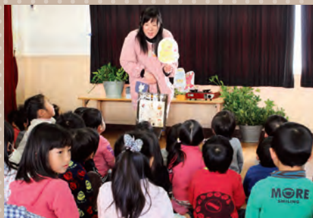
▲節分の由来を分かりやすく紹介