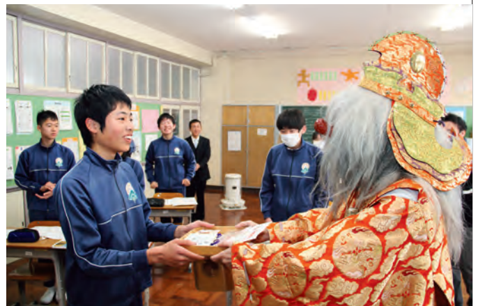
本中・中中は1月26日に、川根高校は昨年12月19日に実施

てんぐと山伏にふんした同組合員から、外森神社の断崖にて数百年とどまり続ける大石にちなんだ合格・安全祈願絵馬を受け取った各校の生徒は「残り少ない時間を大切にしていきたい」「悔いが残らないよう頑張りたい」などと受験への決意を新たにしていました。