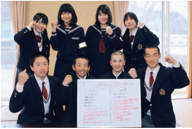
▲「お見合い大作戦」を提案したグループ

「まず、自己紹介をしましょう」。川高生の司会者役から声が掛かり、最初はぎこちない雰囲気が始まった分散会。特に中学生は緊張した面持ちでしたが、次第に打ち解け、活発な意見が出されました。「あいさつをする」「ルールを守る」「自ら積極的に行動する」など、自分たちができることはなんだろうと考え、前向きで積極的な意見が多く出されました。中でも、「テレビで放送されている『お見合い大作戦』を川根地区で実施する」と提