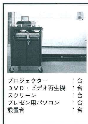
プロジェクター 1台 DVD・ビデオ再生機 1台 スクリーン 1台 プレゼン用パソコン 1台 設置台 1台