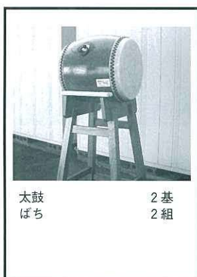
太鼓 2基 ばち 2組