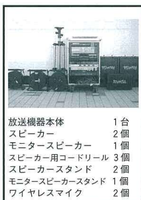
放送機器本体 1台 スピーカー 2個 モニタースピーカー 1個 スピーカー用コードリール 3個 スピーカースタンド 2個 モニタースピーカースタンド 1個 ワイヤレスマイク 2個