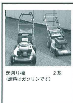
芝刈り機 2基 （燃料はガソリンです）