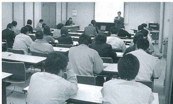
1月に行われた勉強会の様子

このエコアクション21川根本町実施委員会とは、副町長を実施委員会委員長として、各課室局長を実施委員会委員、各課室局の課長補佐、主幹、係長級職員1名を実施委員会幹事として、エコアクション21の導入準備とその運用を行う組織です。