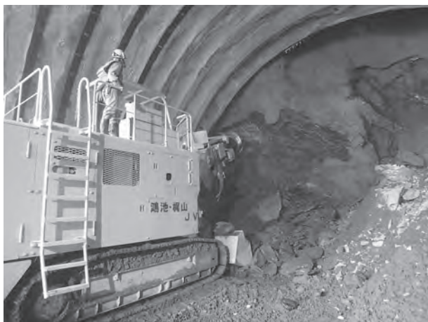
▲掘削機「ロードヘッダー」による掘削作業