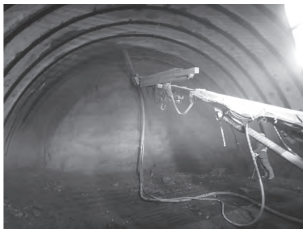
▲コンクリート吹付機による吹付作業