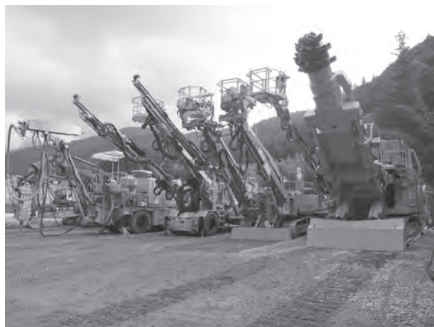
▲トンネル掘削に使用する機械