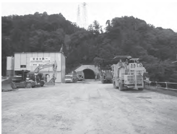
▲トンネル工事現場（青部区側）