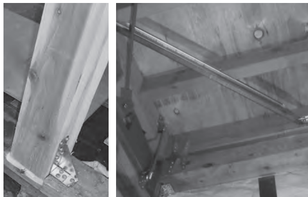
▲耐震補強工事における施工の一例

建設課(本庁) 建設管理室 ☎(56)2227 (総合支所) 産業建設室 ☎(58)7076