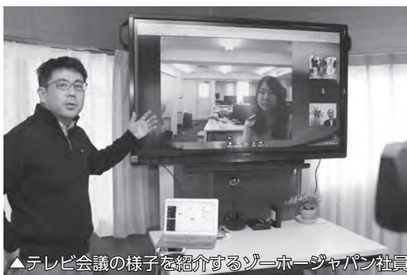
▲テレビ会議の様子を紹介するゾーホージャパン社員