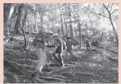
秋のトレッキングの様子。自然の美しさはもちろんのこと、ガイドの説明や心のこもったおもてなしも好評です。

さ て、バードウォッチング企画の記念すべき第一回(1月)の開催地は寸又峡。冬だからお客様が来ないのではなく、「冬だからこそ」できることを実践していきます。初めての試みなのでうまくいくかどうか分かりませんが、Try(トライ) & Error(エラー) = 試行錯誤するしか方法はありませんから。