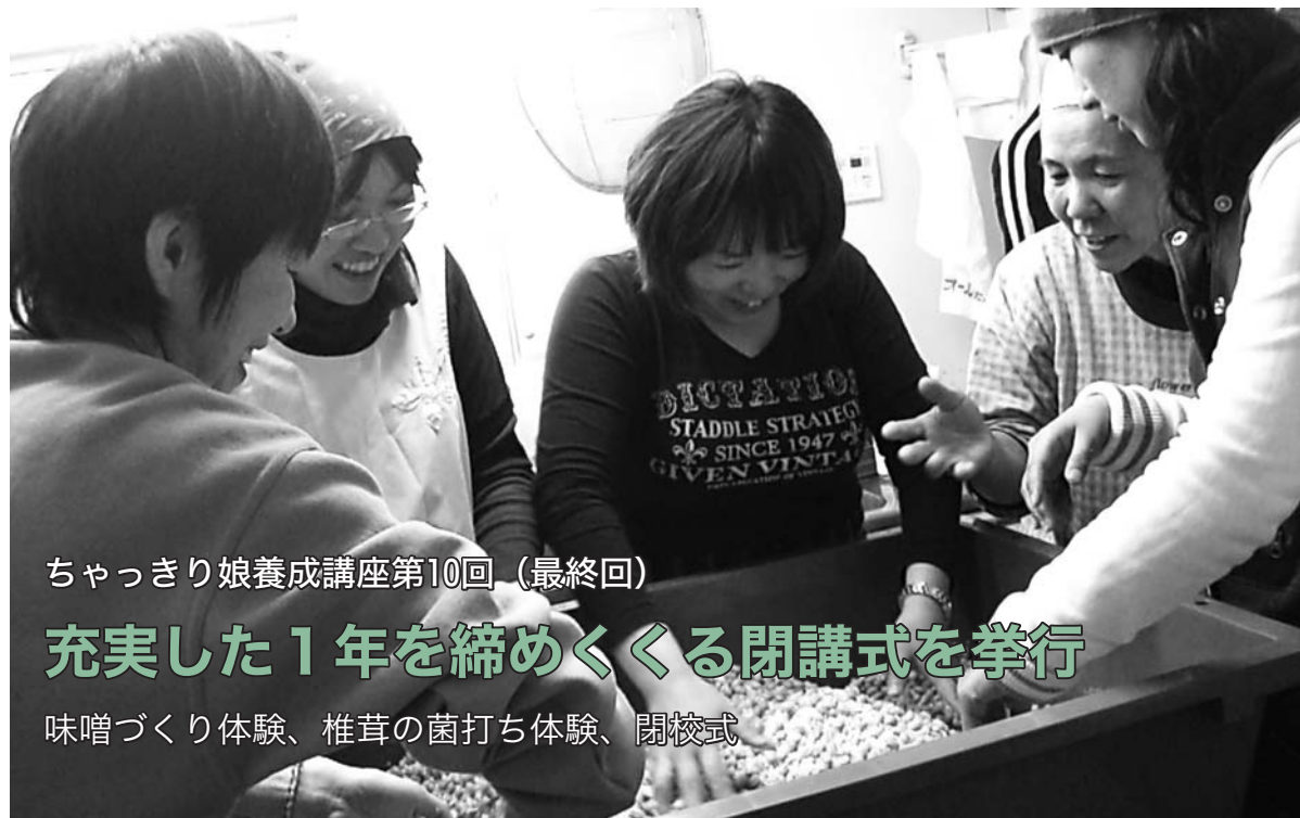
ちゃっきり娘養成講座第10回（最終回）