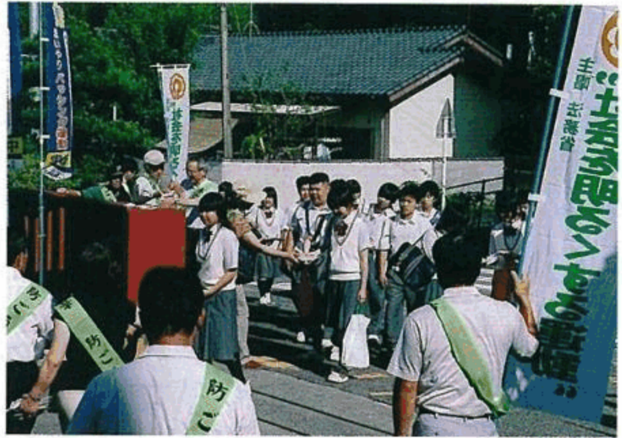
社会を明るくする運動