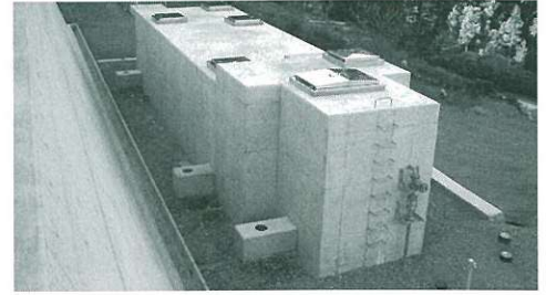
田野口簡易水道の浄水場にある沈殿池