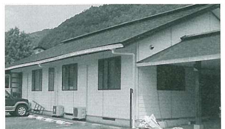
改修工事中の「いやしの里診療所」