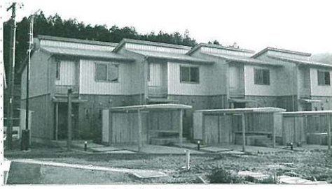
地名 若者定住促進住宅