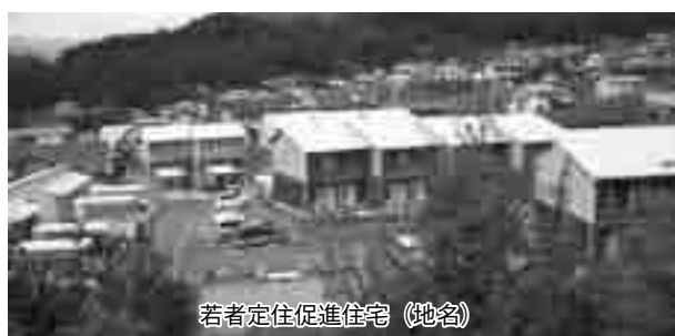
若者定住促進住宅（地名）

質問 財政規模の内、基金残高は？ 総務課長 ざっとですけれども基金は38億円、借入が60億円です。 質問 市場調査・開拓などを行い、市場を認識して財政に反映させるべきではないか。 町長 民間活力、住民生活向上支援のため、事業を計画し、整備してきております。 質問 土地政策に関してですが、今回は「移住定住推進事業」について伺います。 副町長 この過程で交流のための組織・事業、条例の制定、空き家整備事業などの財政支出が見込まれますが、定住者の投資や地域貢献も見込まれる事業と考えられるのでは？ 町長 平成21年の空き家調査によれば、260件ほどになっております。高齢独居世帯は40件で総世帯数の14%となり、喫緊の課題として認識し、連携体制を構築したい。 質問 今後の具体的取り組みについては？ 企画課長 受け入れ側としまして、連携組織による対策委員会を検討していきたい。 質問 若者定住促進住宅の方々の将来的受け皿を作っていく必要があると考えますが。 副町長 若者定住住宅は年齢等制限があるという点もありません。例えば引き続き居住生活できるかどうかとかも、今後検討していかなければなりません。 質問 公共用財産、駐車場、公共施設、水道・道路用地などが、過去の経緯から私有地だったりしているが、その辺の状況をお知らせいただききたい。 町長 今後、事業実施に当たっては用地の先行取得を基本に対応してまいりたい。借地料につきましては、場所