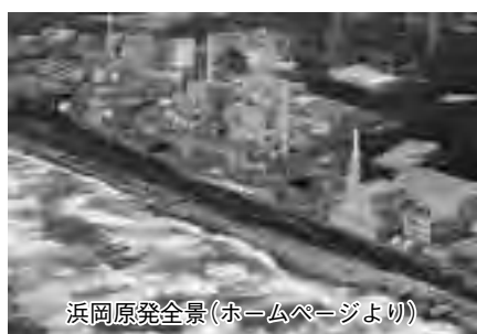
浜岡原発全景(ホームページより)

人数は125人、実人数は77人、内入所の必要性が高い方が20名となっている。アンケートでは在宅介護希望が約7割と高いので、第5期計画に新規施設は立てず、在宅でサービスが受けられ重度化しないよう予防・支援を重点的にやりたい。②今回の制度改正で利用できなくなった報告は受けていない。サービス提供の適正化や軽減制度の周知を行い、利用者の負担軽減に努める。高齢化率は42%と県内で最高だが、元気な高齢者が多く、今後も介護予防事業を推進し、多くの人が参加できるように取り組んで、給付費や保険料の抑制に努めたい。 質問 浜岡原発の再稼働に反対し、原発に頼らない再生可能な自然エネルギーの推進、教育的取り組みについて。