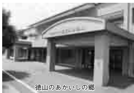
徳山のあかいしの郷

質問 ①低迷が続く観光と茶業の連携や6次産業化の推進で再生を。②消費者が求める安全・安心の循環型農業や多品種生産で特色と魅力あるまちづくりを。 町長 ①荒茶価格の低迷で収入は減少し、頑張っている茶農家や共同工場さえ、続ける意欲を無くす危険性が強まっている。高齢化による労力不足の解消や品質向上のための共同摘採化や茶収益減少を補完する農作物の導入や、町の資金投入で法人を立ち上げ、摘採班・生産班を組織して雇用創出を図り、耕作放棄地を増やさないようになりたい。加工所建設、体験農業、市場への運搬等を支援し、全品出品者や自園自製自販農家が行っている茶縁喫茶等消費者とのふれあいを大切にし、観光との連携を進めたい。