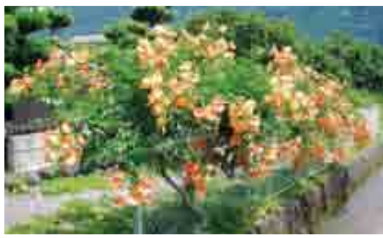
町内を彩っているアイセンカツラの花