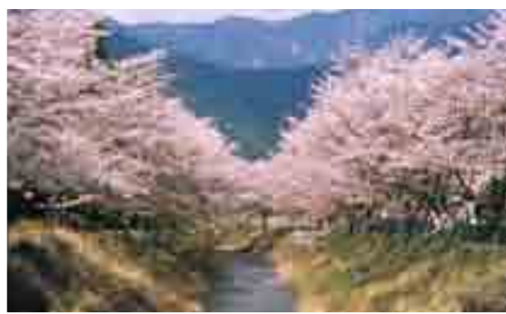
徳山・桃沢川の桜