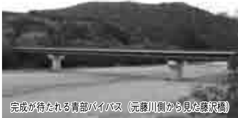
完成が待たれる青部バイパス (元藤川側から見た藤沢橋)

また、観光シーズンや朝晩の通勤車両の多い時間帯の交通渋滞、また、大型車両同士のすれ違い困難等により、緊急車両の通行や観光業・製造業等に悪影響を及ぼしていることは間違いのないことであり、早急に解消するため、関係機関に対しまして要望活動を行ってまいります。