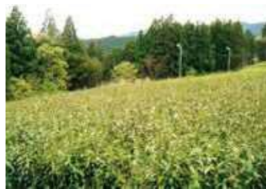
増え続ける耕作放棄地

答 農業委員が担当している地区ごとに調査。機構集積支援員によりフォローアップする。