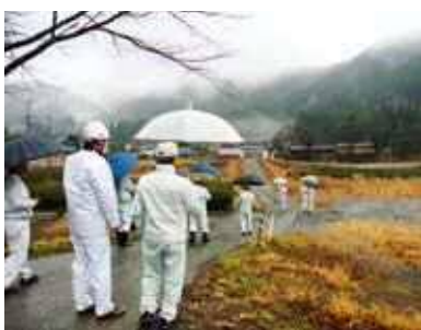
青部土捨て場予定地視察