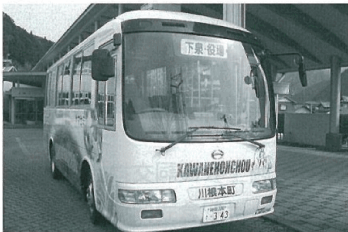
町営バスの運行経路の拡大

川根本町の過疎地域自立促進計画が、12月20日の議会で議決されました。これは法律により過疎地域に指定された自治体(町)の活性化を図り、町の自立促進を図ることなどを目的に国が財政支援を行うことを内容とするものです。財政支援は、今までも法律の名前 の方法は、町で起こす町債(借金)の元利償還に要する経費の70%を国がみるというものです。計画の策定にあたっては町は県と協議したうえで、議会の議決を経て、計画を策定します。このよう を変えながら続けられてきていますが、今回は10年を期間とする法律の後半の5年間となる平成17年度から22年度を対象とするものです。 計画にもられる事業の内容は、産業の振興、交通や生活環境の整備、福祉の増進、医療