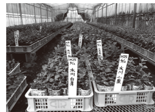
農林業センターでは茶の品種研究が行われている (産業課・茶業推進対策関係)