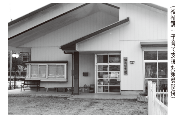
支援センターとして利用されている (「元地名保育園」) (福祉課・子育て支援対策関係)