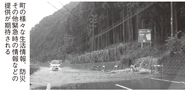
町の様々な生活情報、防災その他緊急時の情報などの提供が期待される

7条の管理運営では、設備を電気通信事業者に提供する場合、IRU契約を締結して、継続かつ安定的なサービスの提供を定めています。 8条では利用者の同意を、9条では利用料を、10条では引き込み工事等の費用について定めています。 11条からは、引き込み工事の負担金の納付、減免、設備の移設、破損、利用の中止、再開、承認の取り消し、損害賠償等について定めています。