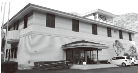
資料館内には歴史・学術的に貴重な資料が展示されている

展示物の保護の面で、建物内で物品販売は不可能です。 質問 カヌー競技場跡の再活用について伺う。現在B&Gが所有している艇はカヌー、カヤック等38艇はありと聞いています。これらの豊富な機材を利用して更なる観光面での利用について伺う。 町長 長島ダムは地域に開かれたダムとして、湖面利用も様々な利活用が可能なダムとなっております。エコツーリズムネットワーク事業を中心に関係機関とともに今後さらなる活用方策等に関係機関とともに協議を進めていく必要があると考えています。 質問 寸又川左岸の改修の可能性はあるか。 町長 現在、寸又川左岸の状態は極めて悪い状態です。しかし静岡県の表玄関である寸又川左岸が通れるように