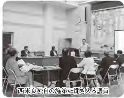
西米良独自の施策に聞き入る議員