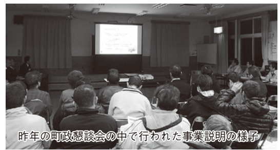
昨年の町政懇談会の中で行われた事業説明の様子

4条の事業の内容では、光ネットワークを活用して行う事業に、 ①行政情報の提供、②福祉、生活、文化及び教育の向上並びに産業振興等の各種情報の提供、③災害その他緊急情報の提供、④その他町長が必要と認める事業を定めています。6条では、利用者を①町民、②町内に事業所を有する者、③町内に住宅を有する者、④公的機関などとしています。