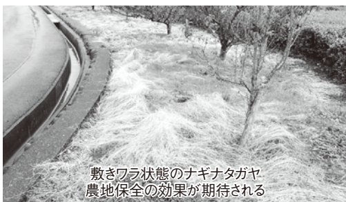
敷きワラ状態のナギナタガヤ 農地保全の効果が期待される