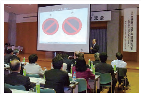
地域防災対策と危機管理の講演を聴く (11/4吉田町)