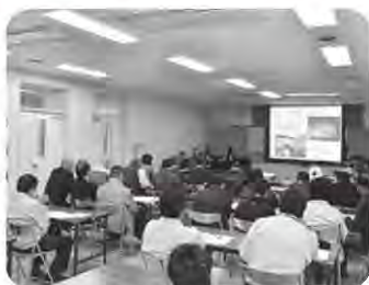
報告会の様子(文化会館)