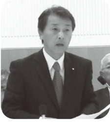
藪田 靖邦 議員