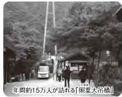
年間約15万人が訪れる「照葉大吊橋」