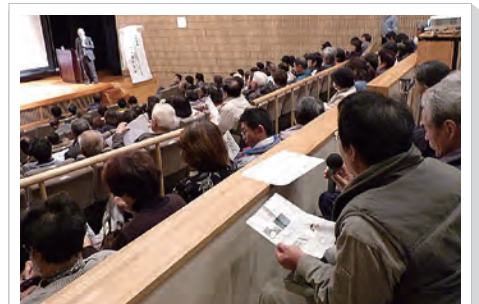
多くの町民が参加した報告会 (12/13文化会館)