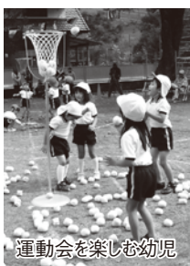
運動会を楽しむ幼児

町長 条例では撤去費用を頂くようになっていますが、当然ながら防災の関係上設置も無料であり、撤去費用を頂