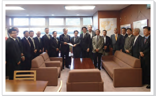
国交省での国道362号整備要望 (10/30東京)