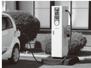
電気自動車用充電施設の設置例 (写真はイメージ)