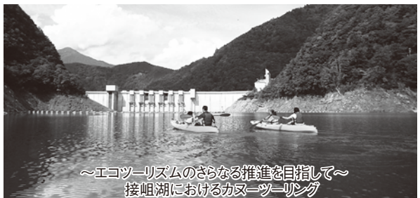
～エコツアーリズムのさらなる推進を目指して～ 接岨湖におけるカヌーツーリング

様々な取り組みをより一層拡充していくことにより、推進していきたいと考えている。施設整備に関しては、当面は寸又峡山岳図書館・資料館やまびこ・フォールレなかかわね茶茗館をエコパークの情報発信拠点施設として、エコパークに関する様々な情報を提供するよう随時対応していくものとしている。光岳アクセス道路である寸又川左岸林道の整備については、現在、森林管理署のみならず、環境省、県等の関係機関とも様々な協議検討を行っている状況である。