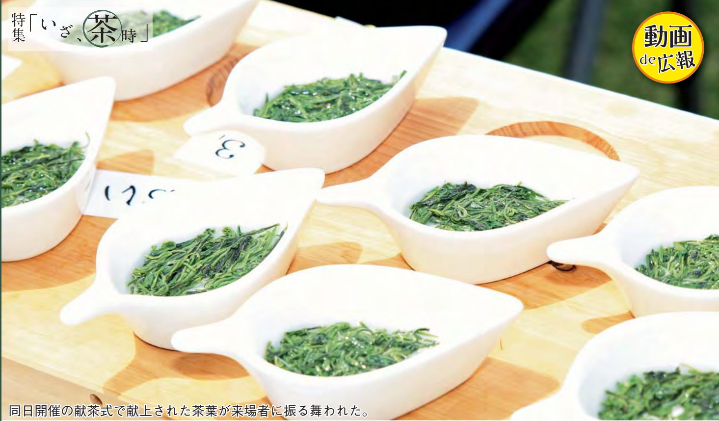
同日開催の献茶式で献上された茶葉が来場者に振る舞われた。