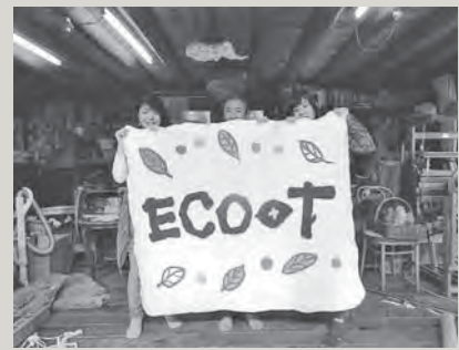
エコティ事務所の玄関マットを女性会員で手作りしました。羊毛100%の温かみあるマットでお出迎えます。

故 郷を離れ川根で暮らす私ができる精一杯の言葉です。「エコツーリズムっていいな、ガイドやコーディネーターの仕事って素敵だな」と憧れられるような存在を目指します。