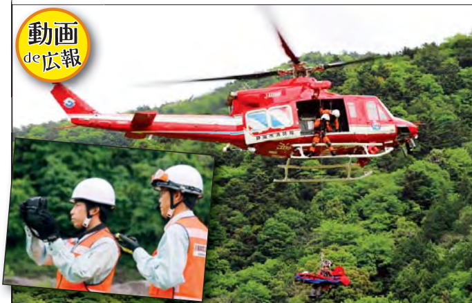
町職員による現地確認の後、防災ヘリで救助しました

静岡市消防局と町は、長島公園(接岨区)にて合同山岳救助訓練を行い、消防隊員や町職員など関係者約45人が参加しました。