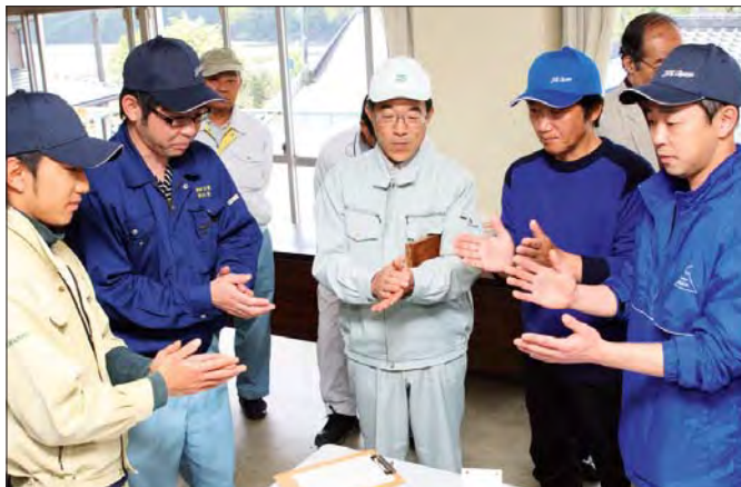
最高値は2万8,800円、平均単価は9,083円でした

今シーズンの活発な取引を祈願した開所式の後、初取引が行われ、初日は19口・482 キ が上場しました。買い手が新茶の香りや色合いを慎重に見定めると、そろばんを持った仲介人が生産者との間に入り交渉が始まりました。商談が成立すると、会場には「シャンシャン」と威勢の良い手締め之音が響き渡りました。