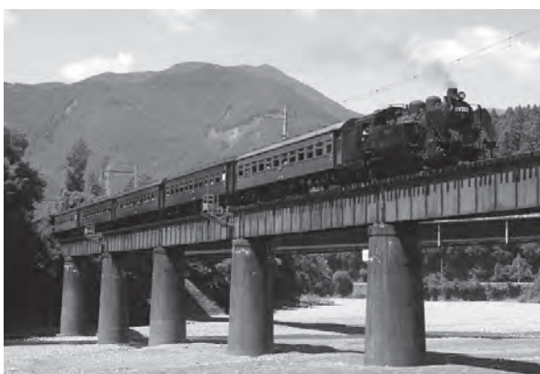
大井川鐵道 SL乗車券

川根本町のまちづくり施策にご理解いただき、ご支援くださいますようお願いいたします。