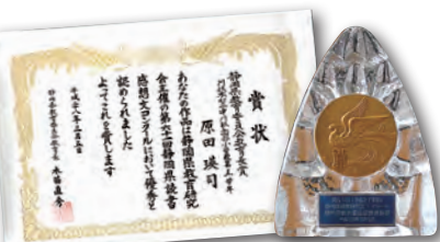
▲県教育長賞の賞状と トロフィー