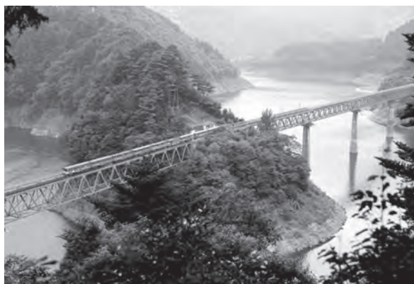
南アルプス あぶとライン 乗車券