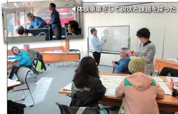
◀体験乗車をして現状と課題を探った