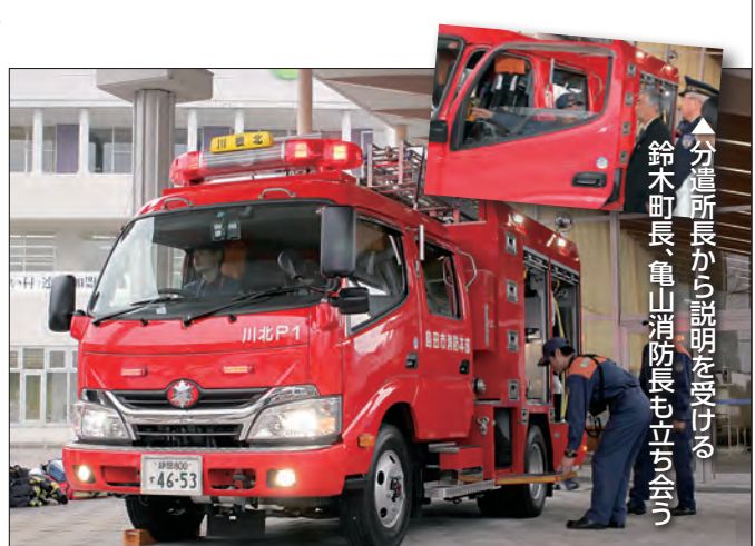
車両はコンパクトになったが、性能は大幅に向上した新型車

亀山消防長は「性能が向上した新型車両を配備することで、町民の皆さまの生命・財産を守るよう努めていきたい」と話しました。