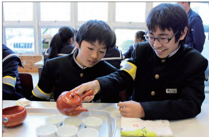
学んだ入れ方でグループのメンバーにお茶を振る舞う生徒

最初に講師の代表が、おいしくお茶を入れるためのコツについて実演・説明をしました。次に、生徒らは数人のグループに分かれて、教わった手順を実践して同じグループの生徒に呈茶しました。普通煎茶だけでなく玉露やほうじ茶など8種類の茶が用意され、生徒からは、湯の温度や入れ方で茶の味が変わることに驚きの声が上がりました。