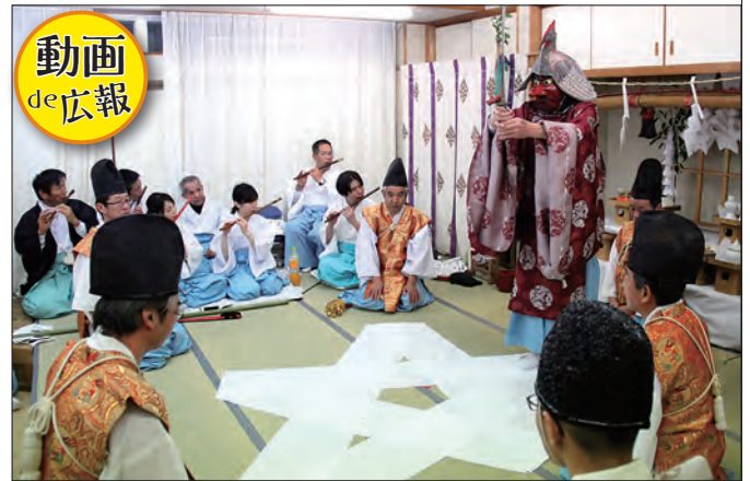
星型に敷いたさらし木綿の上を齋主が移動する「ヘンバイ」

多くの町民や神楽ファンが訪れる中、夕方から深夜にかけて梅津神楽保存会のメンバーや地元小学生らが優雅な舞を披露し、五穀豊穰や家内安全、心身健康などを祈りました。今年は、全17演目の終了後に、特別な祈願の儀式である「ヘンバイ」が執り行われました。笑い声や歓声が響いた演目と打って変わって、厳かで張り詰めた空気の中で無事に儀式が終了すると、見物人からは拍手がわき起こりました。