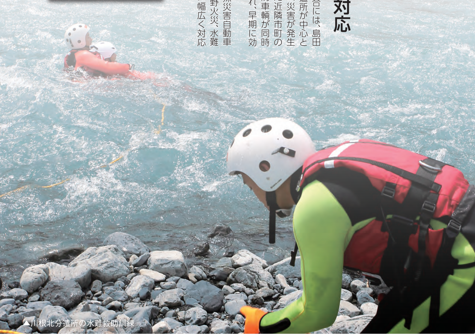
▲川根北分遣所の水難救助訓練

また、消防ヘリコプターやはしご車、特殊災害自動車などの特殊車輛を活用することにより、林野火災、水難事故、大規模災害などの多様化する災害に幅広く対応することができまます。