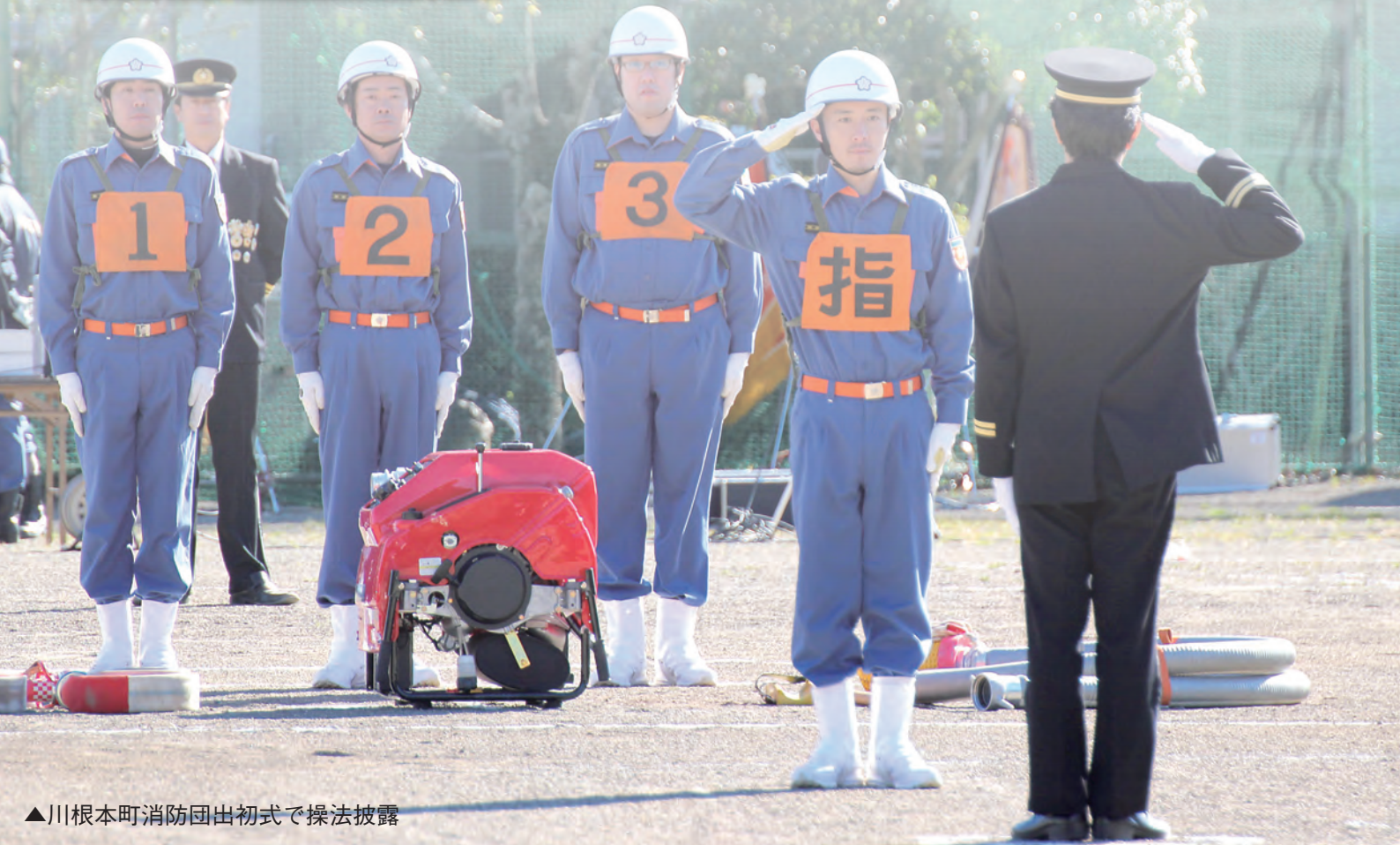
▲川根本町消防団出初式で操法披露

「町民の生命・財産を守るため、常に安全に配慮して、使命感と責任感を持って団活動を遂行して欲しい」と常日頃から団員に願ひ、呼び掛けています。多様化する災害に対し、広大な町域で活動する本団にとって、119番通報の一括受け入れによって指揮命令系統の体制が強化されることや、到着時間の短縮など、消防広域化によって得られるさまざまなメリットに期待しています。 本団においても、今まで以上に連携を深め、「自分たちの町は自分たちで守る」を合言葉に、町民の皆さまに信頼いただけるよう精進してまいります。