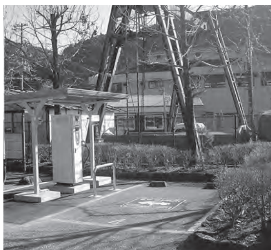
▲道の駅駐車場入り口駐輪場すぐ横

川根のみきていが綴る「ブログ版 川根本町エコツアー日記」もお楽しみに! http://eco2kawane.eshizuoka.jp/