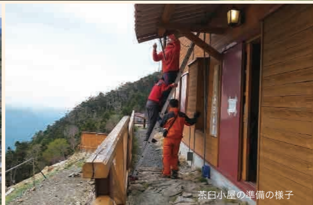
茶臼小屋の準備の様子

ユネスコエコパークに登録された、静岡市井川と川根本町の魅力を伝える、地域でつくる新聞