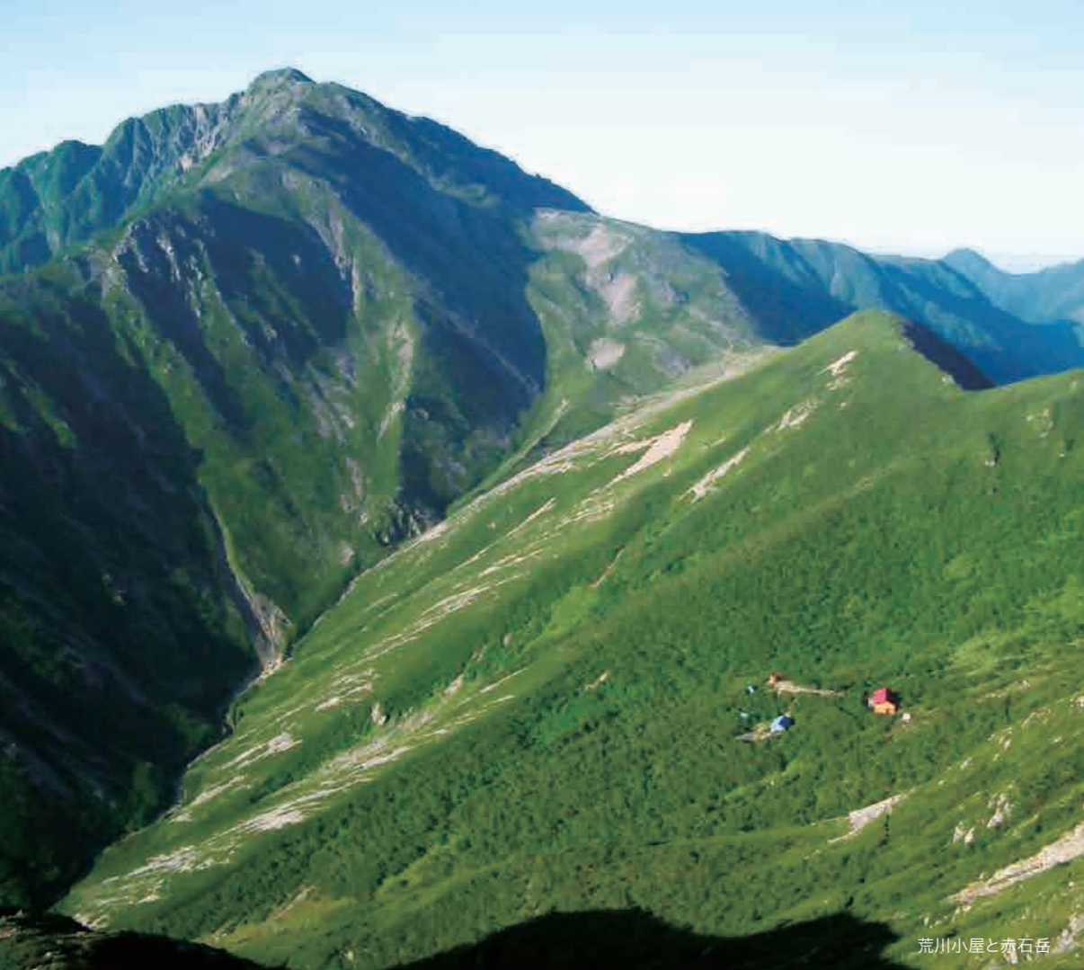
荒川小屋と赤石岳