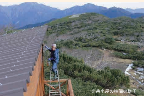
光岳小屋の準備の様子