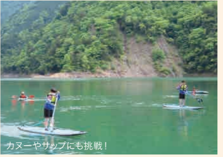
カヌーやサップにも挑戦!

5月10日(火)、本川根中の2年生と本校の中学生3名とで、接岨湖にてボート体験をしました。はじめはみんなの漕ぐタイミングがバラバラで、なかなかボートが前に進まなかったけれど、だんだん声が出て漕ぐタイミングがそろい、帰りは速くボートを進めることができました。きれいな景色を楽しみながら、ボート以外にもカヌーやサップにも挑戦しました。体験の最後は、接岨湖の中にみんなで飛び込みました。湖の水はとても冷たかったけれど、本川根中の友達とは少し距離が縮まったと思います。